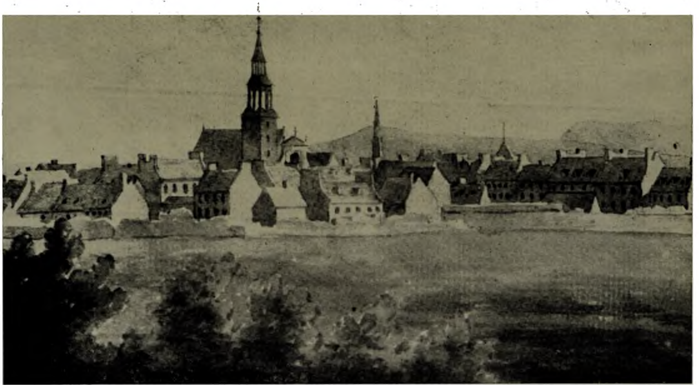
Vue de Montréal, prise de la maison de campagne de M. Frobisher, par George Heriot.