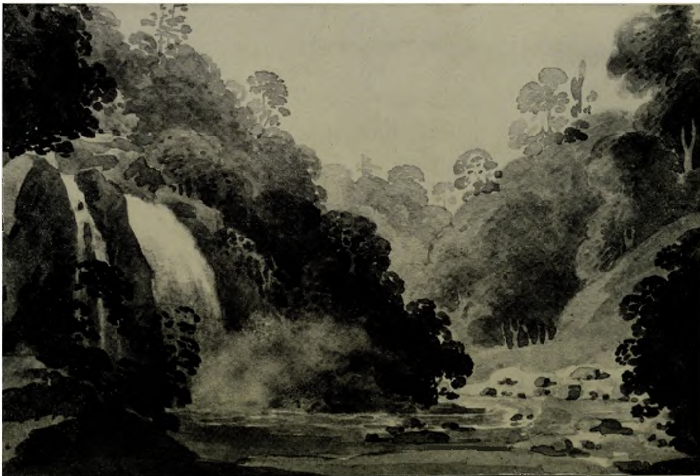
Le Sault-à-la-Puce, par George Heriot (1812).