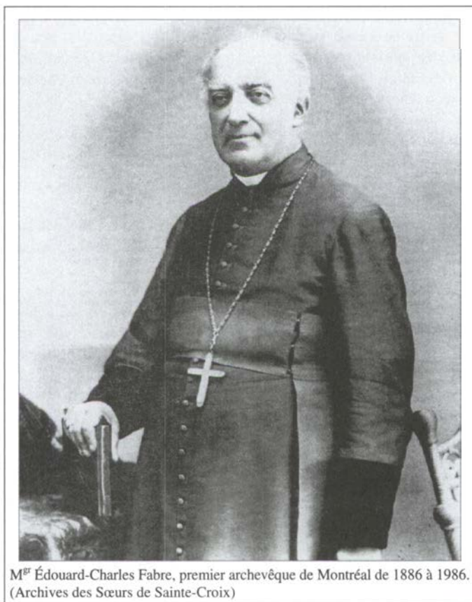
M gr Édouard-Charles Fabre, premier archevêque de Montréal de 1886 à 1986.