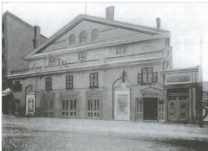
Le Théâtre royal où eurent lieu de nombreux spectacles sujets aux foudres morales du clergé montréalais.

Deux journaux plus libéraux raillent Royal. Le Pays croit fermement que le commentateur de L'Ordre se serait précipité au théâtre si son journal avait réussi à vendre de la publicité aux deux troupes et, par le fait même, obtenu des billets de faveur; sa réaction s'abreuverait donc au dépit 6 . La Guêpe conclut pour sa part «qu'il vaut mieux ne pas servir la cause de la religion et de la moralité que de la servir sous le masque de l'hypocrisie 7 ».