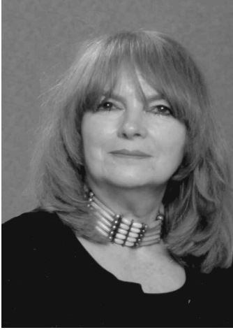
Centre de recherche Lionel-Groulx