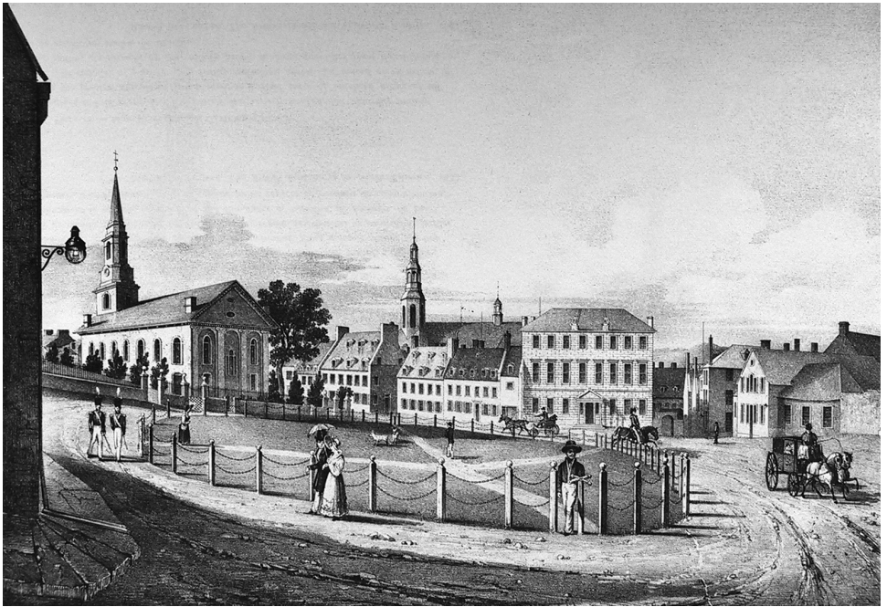
La place d'Armes dans la haute-ville de Québec où se côtoient le style palladien de la cathédrale Holy Trinity et de l'hôtel Union (à gauche) et le style vernaculaire canadien des maisons et de la cathédrale catholique (au centre). Lithographie de W. Walton d'après un dessin de R.A. Sproule, 1832.

Ainsi, au cours de la première moitié du XIX e siècle, des immeubles de style palladien ou néoclassiques côtoient l'architecture canadienne traditionnelle dans un étonnant mélange qui n'a pas échappé aux visiteurs de passage à Québec 7 .