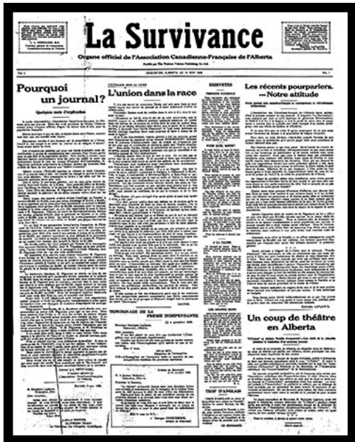
Figure 1a 1 e page du 1 er numéro du 27 novembre 1928 de La Survivance : l'image est absente pour la majorité des premières pages pendant plusieurs années.