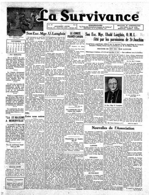
Figure 1b 1 e page du 23 novembre 1938 de La Survivance : depuis quelques années apparaissent une ou quelques images, surtout des photos, à la 1 e page.