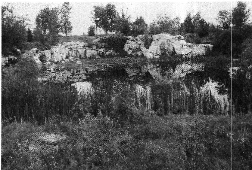
Photo 3 : Petite carrière de marbre dans la région de Stukeley-sud en voie de restauration naturelle. Les abords de l'excavation sont cependant jonchés de débris divers et de rejets de pierre de taille qu'il faudrait collecter et enfouir.