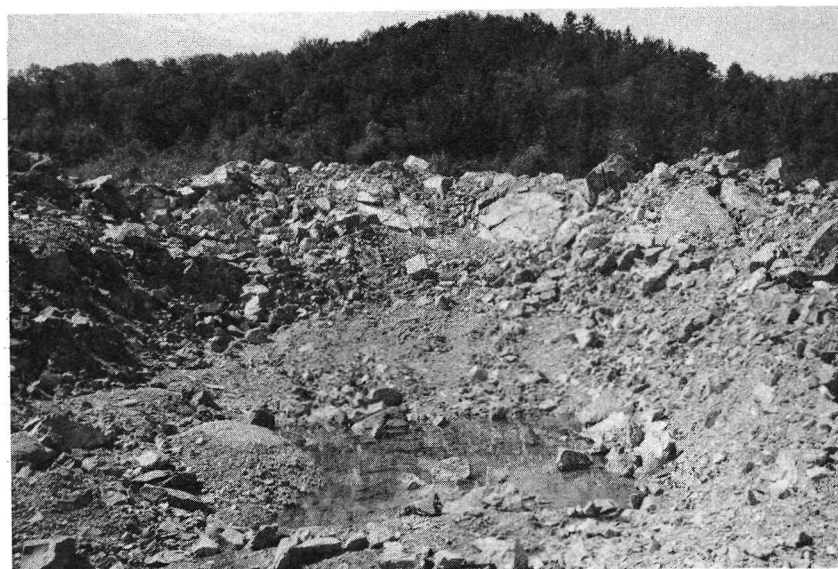
Photo 2 : Travaux d'exploration près de Ham-Sud. On avait creusé à cet endroit un tunnel qui a été dynamité à la fin des travaux d'exploration. Cependant, le terrain n'a pas été remis dans l'état où il se trouvait à l'origine.