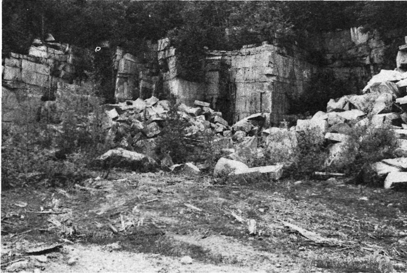
Photo 5 : Carrière de granite abandonnée dans la région de St-Gérard (Disraéli). Cette excavation à flanc de coteau est en voie de restauration naturelle et ne présente aucun danger pour des visiteurs éventuels.