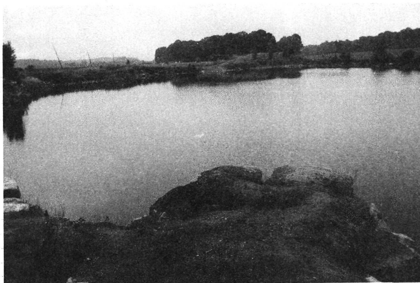
Photo 1 : Carrière abandonnée de Saint-Alexis (Carrières Montmartre). Au mois d'août 1980, une jeune fille se noyait dans cette carrière située près du centre du village.