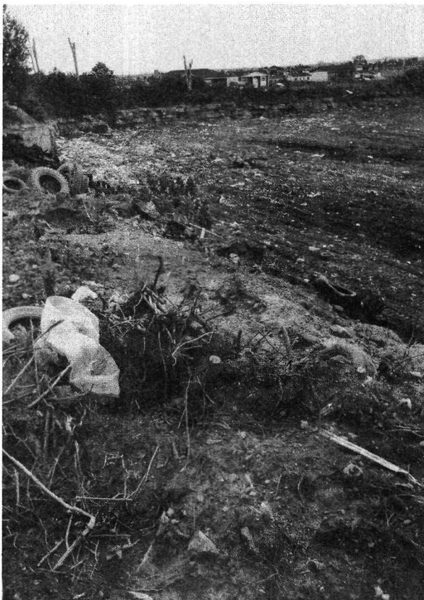
Photo 4 : Carrière BOMAR (Laval) utilisée comme site d'enfouissement de déchets. À noter ici les déchets autour du site et la mauvaise gestion générale de l'enfouissement, et ceci à proximité d'une zone résidentielle.