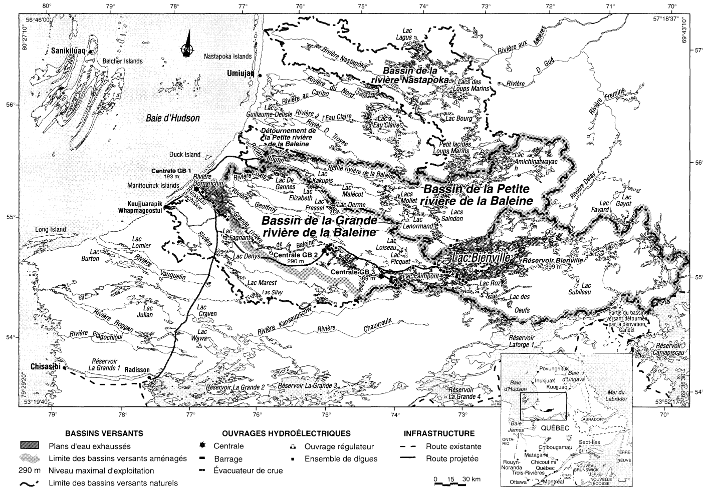
Figure 1 Le projet Grande-Baleine tel que présenté par Hydro-Québec en 1993