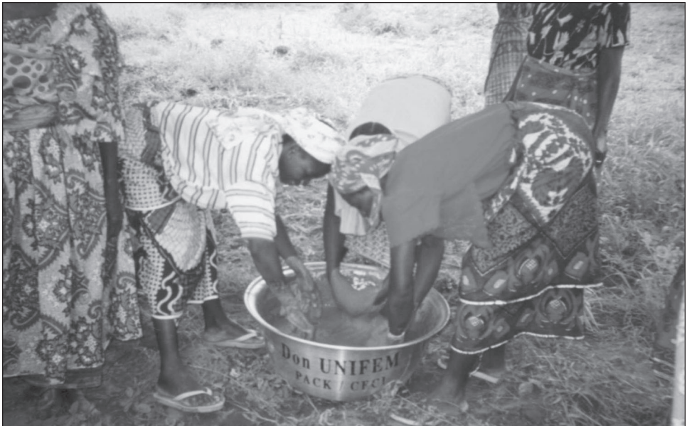
Figure 6 Productrices de beurre effectuant le barattage

Plusieurs femmes participent collectivement à la transformation de noix de karité en beurre. Elles décortiquent d'abord les noix à la main, puis les concassent pour libérer les amandes de karité, qui sont torréfiées et écrasées dans un mortier à l'aide d'un pilon. Le produit est ensuite laminé, ou moulu, contre une grosse roche avec une petite pierre, afin d'être raffiné. L'ajout d'eau crée une pâte épaisse et brune que deux ou trois femmes à la fois s'acharnent à baratter pour faire surgir en surface une mousse grisâtre (figure 6). Cette mousse est transférée dans un premier seau d'eau,