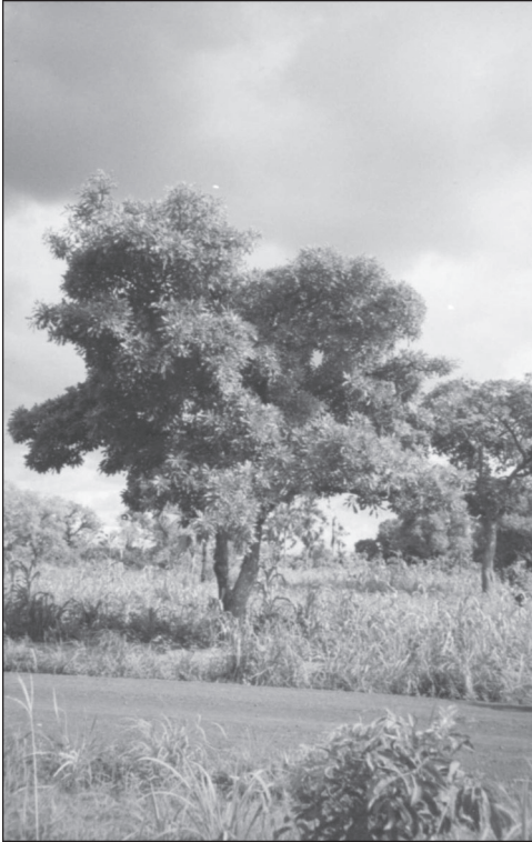
Figure 4 Arbre à karité