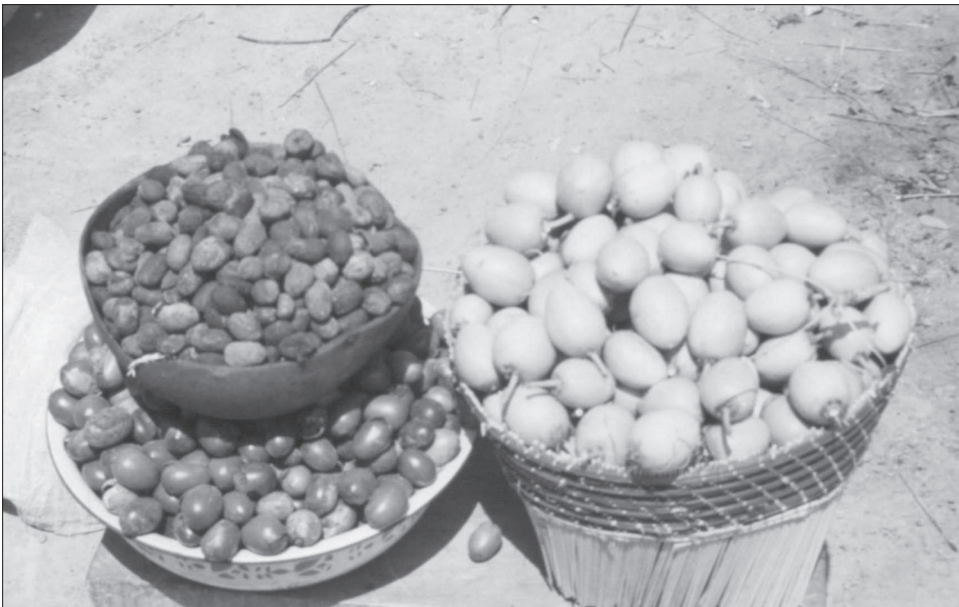
Figure 5 Fruits, noix et amandes de karité

L'implication coutumière des femmes dans la collecte et le traitement du karité est la caractéristique la plus marquante du produit. Le karité est un des rares biens détenant une valeur économique qui demeure sous le contrôle des femmes soudano-sahéliennes. En effet, celles-ci travaillent et commercialisent le karité depuis plusieurs siècles (Lewicki, 1974). L'émergence de marchés internationaux pour le produit offre donc une occasion unique aux femmes rurales qui ont accès à fort peu d'activités rémunératrices (Compaoré, 2000). Cependant, cette occasion dépend de deux