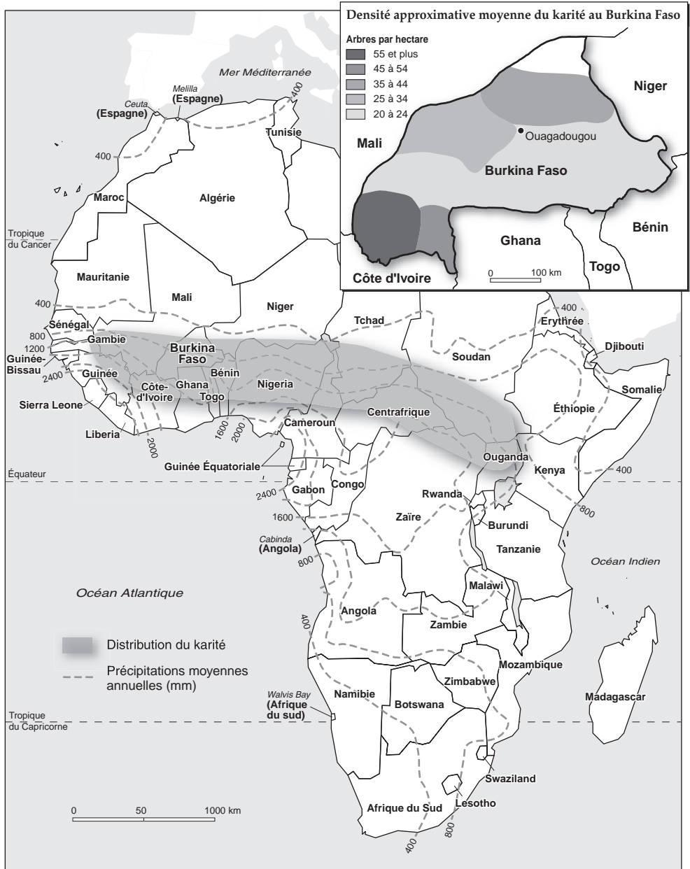
Figure 3 Distribution du karité en Afrique subsaharienne