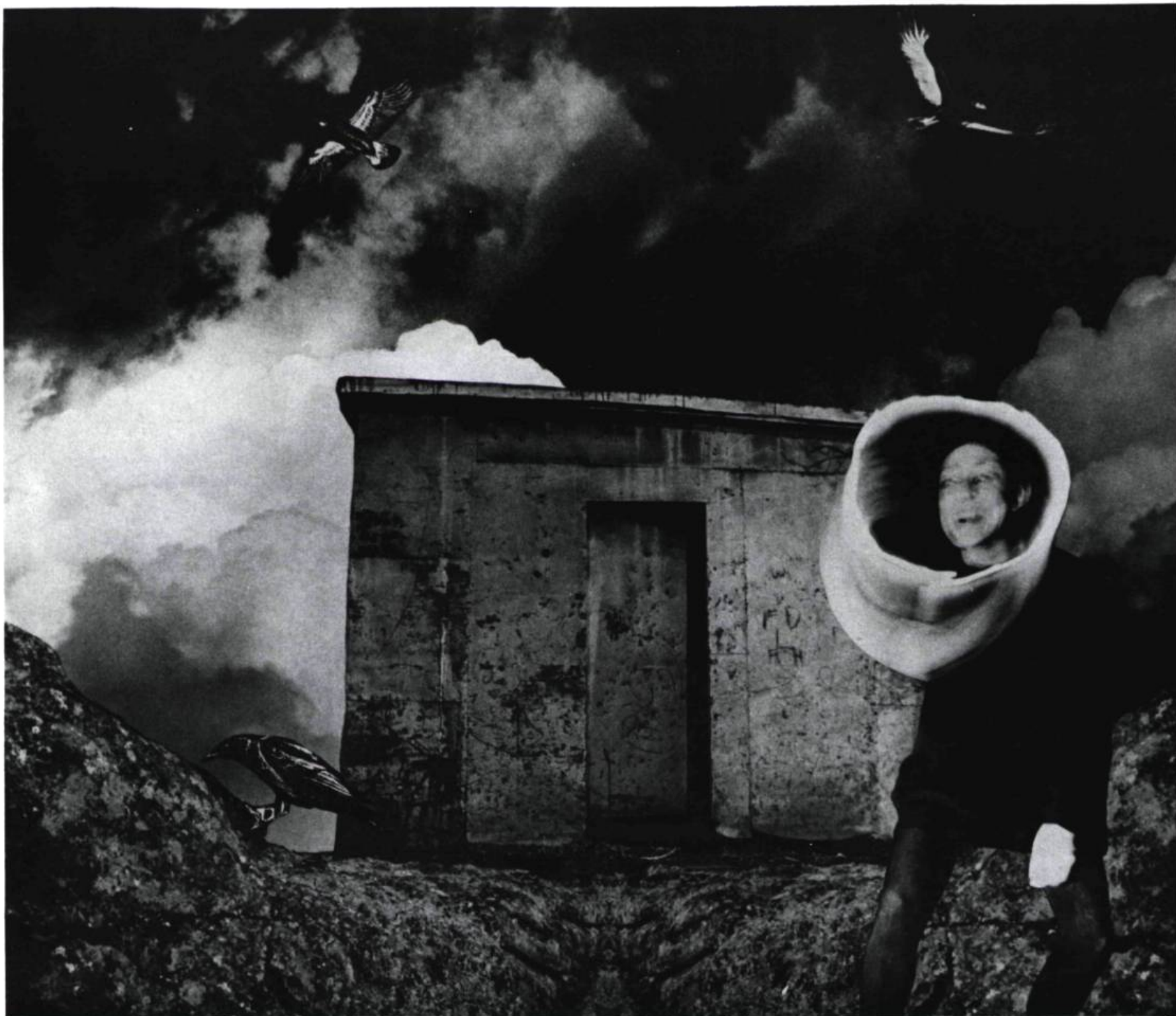
Petit diablotin pris sur le vif exécutant une danse de pouvoir année et lieu inconnu.