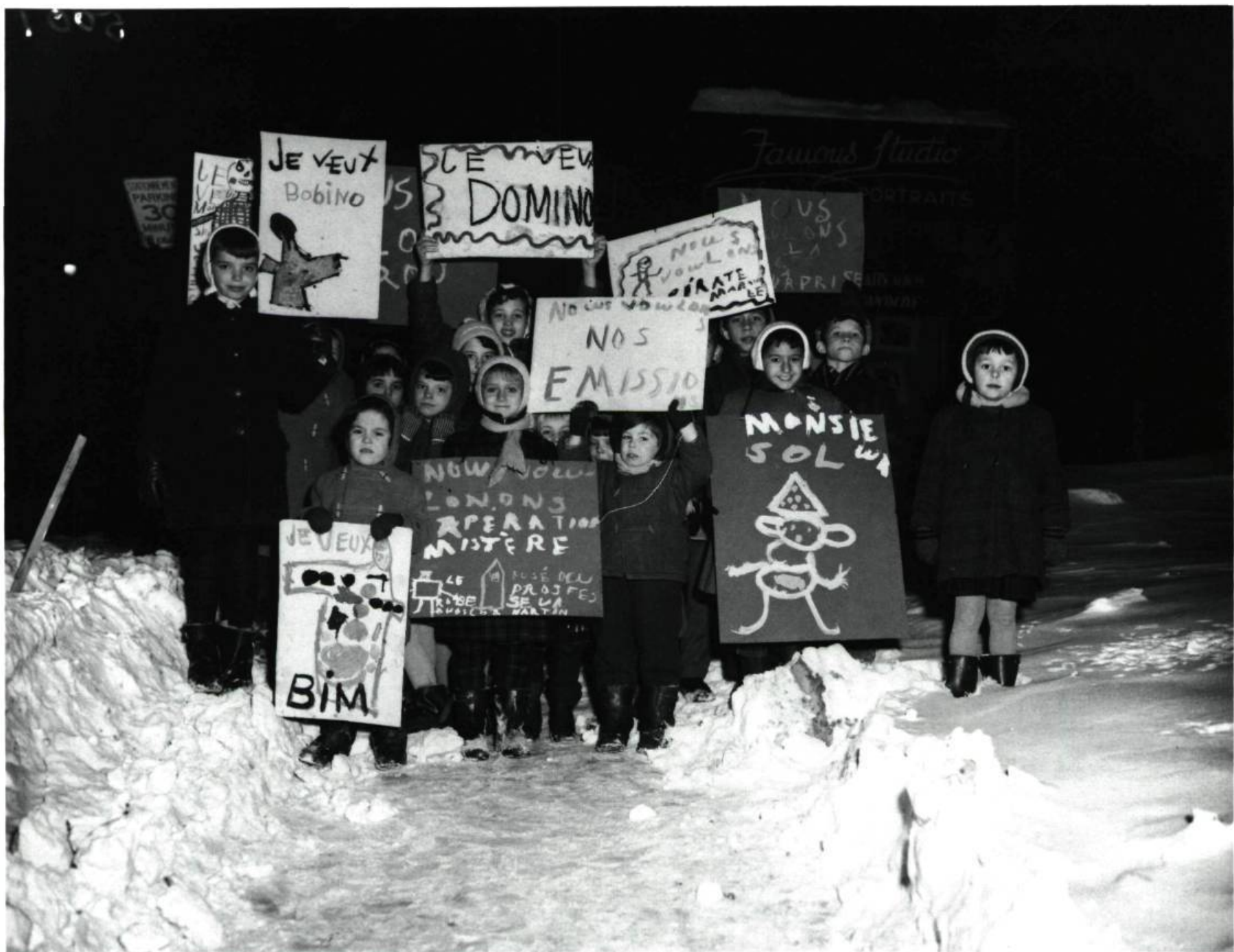
Les enfants des grévistes Grève des réalisateurs de Radio-Canada 18 janvier 1959

« On oublie pas non plus les enfants des grévistes et des sympathisants, dont les distractions ont été rationnées en même temps que le budget familial diminuait: on organise un carnaval des bonbons, auquel prennent part les personnages les plus populaires des émissions de télévision pour la jeunesse. Tous y vont de leurs initiatives, à tel point que les vedettes sont quelquefois annoncées à deux spectacles à la fois. » J.-L. Roux