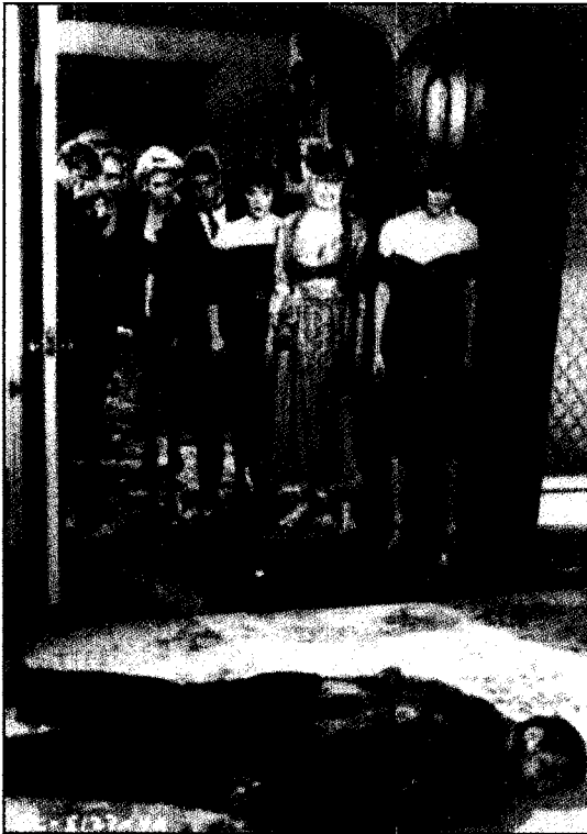
Clue (Jonathan Lynn, 1985)

celle d'élucider le crime. Les questions que le jeu leur impose : qui ? où ? comment ? Les joueurs doivent démasquer le meurtrier parmi six personnages possibles, déterminer l'instrument du crime parmi six armes possibles et découvrir le lieu du crime. Le tableau de jeu consiste en un plan de la demeure de la victime et chaque joueur déplace son pion de manière à pénétrer dans l'une ou l'autre des neuf pièces, l'accès à une pièce lui conférant le droit de mener son enquête par un jeu de questions et de réponses, plutôt simples, de l'ordre de la déduction. La partie prend fin, évidemment, lorsqu'un joueur peut lever le voile sur les circonstances du meurtre 5 .