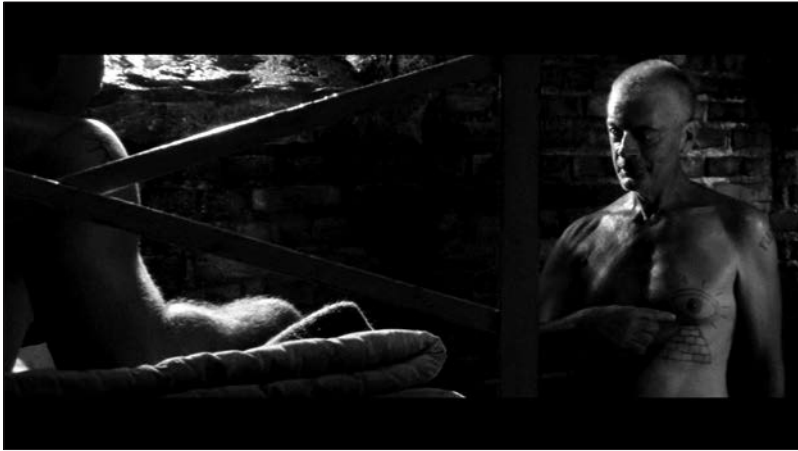
Figure 4 : Zift (Javor Gardev, 2008).

de montrer comment on peut “désenfermer” les disciplines et les faire fonctionner de façon diffuse, multiple, polyvalente dans le corps social tout entier. » Dans la société autoritaire, la technique de surveillance s’instrumentalise et devient le principe de base de l’exercice du pouvoir : « Le schéma panoptique, sans s’effacer ni perdre aucune de ses propriétés, est destiné à se diffuser dans le corps social ; il a pour vocation d’y devenir une fonction généralisée » (Foucault 1975, p. 242). Claude Lefort (1976, p. 179) semble arriver à la même conclusion dans son livre Un homme en trop , où il précise que « le pouvoir [totalitaire] ne deviendra invisible qu’à la condition d’être omniprésent ». Plutôt que de troquer une surveillance inhérente à la peine purgée contre une surveillance globale et masquée — un outil de suppression qui tire son infaillibilité de son caractère imprévisible et de sa portée illimitée — Van Wurst préfère se suicider.