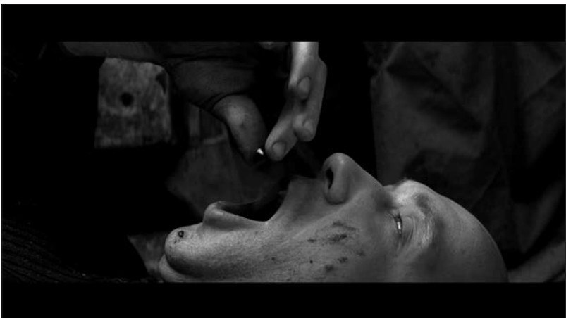
Figure 6 : Zift (Javor Gardev, 2008).

Si sur le plan strictement narratologique l'histoire de Zift est paradoxale, en ce qu'elle nous est racontée par un mourant, sur le plan sémantique, cependant, elle témoigne d'une cohérence imparable. C'est en toute logique qu'elle (commence par la fin et) s'achève au cimetière où le narrateur autodiégétique transmet son récit-confession avant d'expirer. D'ailleurs, l'ultime scène de Zift est tournée de façon à évoquer l'image d'un cadavre dans