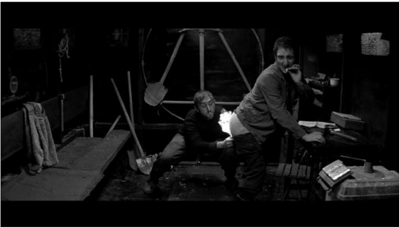
Figure 2 : Zift (Javor Gardev, 2008).

Les éléments scatologiques prolifèrent jusqu'à s'emparer des histoires grossières que racontent à tour de rôle les personnages réunis au service des urgences par la force du hasard. Étrangères au premier abord à l'action narrative principale, dont elles semblent empêcher le déroulement plutôt que de le stimuler, ces histoires n'ont cependant rien de gratuit. Elles s'inscrivent dans l'ambiance générale de fosse d'aisances à laquelle le film tend à associer formellement l'époque représentée. Leur regroupement au beau milieu de la narration filmique témoigne de leur importance structurelle. Qu'elles soient en majeure partie liées aux fonctions intestinales est symptomatique. Celles qui échappent à