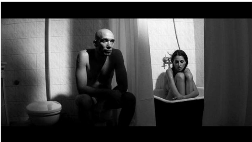
Figure 3 : Zift (Javor Gardev, 2008).

Le rapport constaté ici sert en fait à valoriser un thème déjà mis en place. Celui-ci s'impose d'abord grâce au prénom de l'ex-amante de la Mite, responsable, au même titre que la Limace, de ses déboires passés et actuels. Si « Ada » peut faire penser au roman homonyme de Nabokov, sa puissance allusive réside ailleurs : « Ad » (que l'ajout de l'article indéfini transforme en « ada ») signifie « enfer » en bulgare. On comprend mieux alors la fonction du propos manifestement misogyne qui travaille la nar-