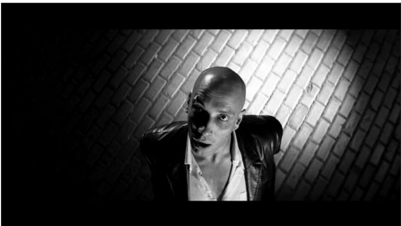
Figure 1 : Zift (Javor Gardev, 2008).

Deux procédés structurels du discours cinématographique s'imposent d'emblée au spectateur de Zift : d'une part, l'obéissance de la composition aux normes du film noir et, d'autre part, l'omniprésence de la dimension scatologique, envahissant l'image et la parole. Que Zift s'approprie le code générique du film noir (le livre de Todorov, quant à lui, se présente d'emblée comme un roman noir par le biais de son sous-titre), sur lequel il brode plus ou moins librement sa propre dynamique, est évident d'entrée de jeu. Ainsi la narration filmique s'inscrit-elle dans un espace urbain et une temporalité dont les limites empêchent l'action de se diluer. Conformément aux conventions du genre, l'essentiel de l'intrigue se déroule la nuit, faisant ressortir le contraste entre le clair et l'obscur, le net et le flou, le figé et le fuyant. La pellicule noir et blanc, la narration prise en charge par la voix off du personnage principal, devenu enquêteur malgré lui, la femme fatale au charme irrésistible qui sait si bien embobiner les hommes, toutes ces composantes concourent à créer le climat général de désarroi et d'expectation typique du film noir. Le sentiment d'échec imminent gouvernant l'existence