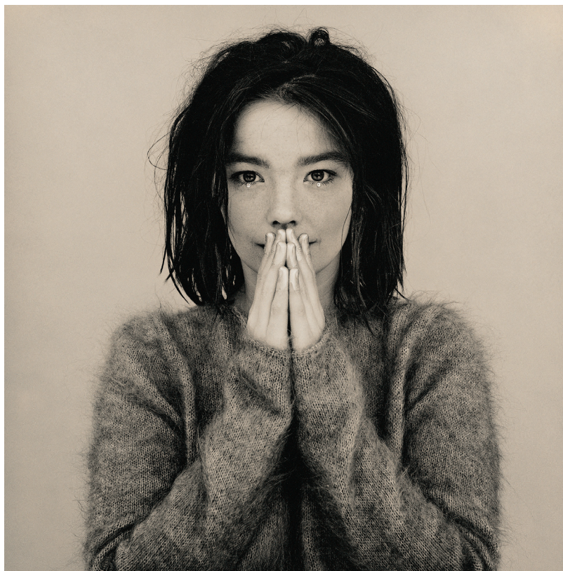
Couverture de l'album Debut (1993).