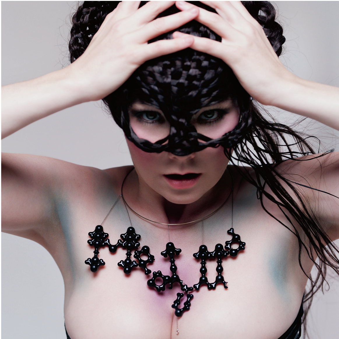
Couverture de l'album Medúlla (2004).