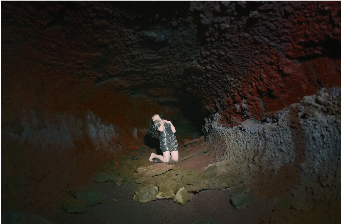
Détail d'une photographie tirée du vidéoclip de «Black Lake» ( Vulnicura , 2015).