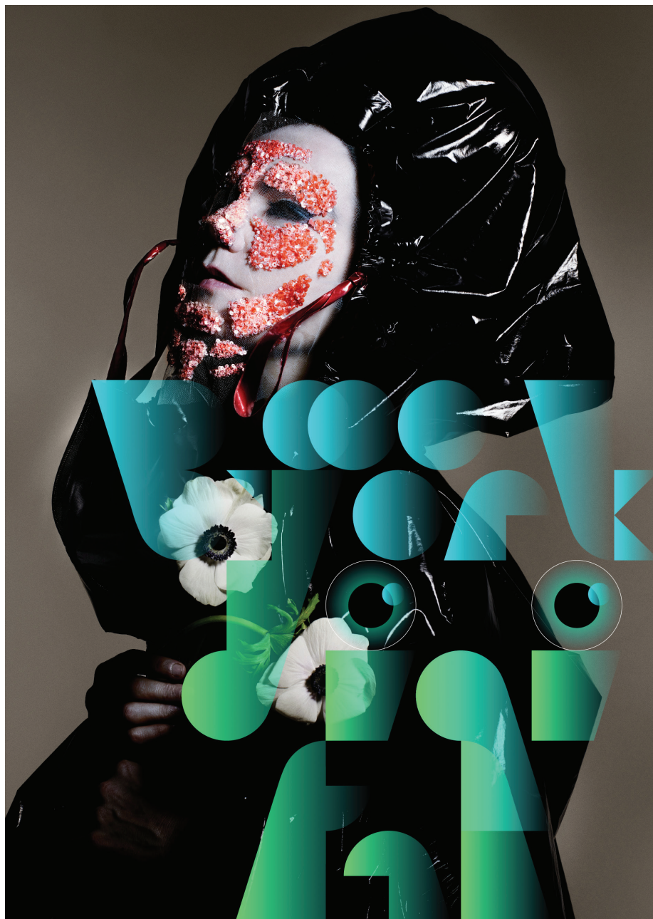
Affiche de l'exposition Björk Digital . typographie par M/M (Paris).