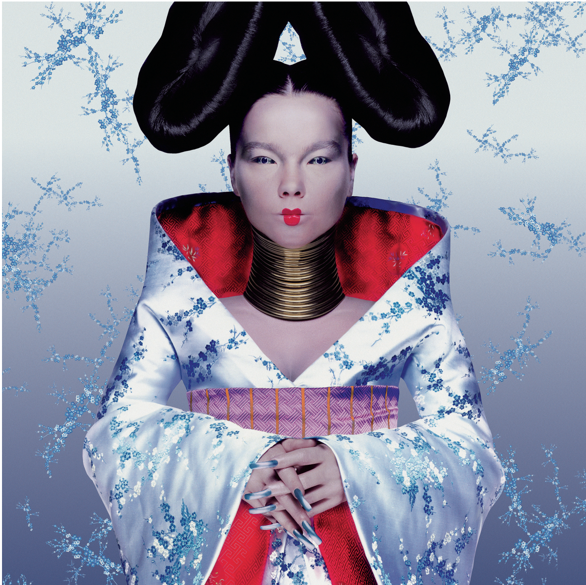
Couverture de l'album Homogenic (1997).