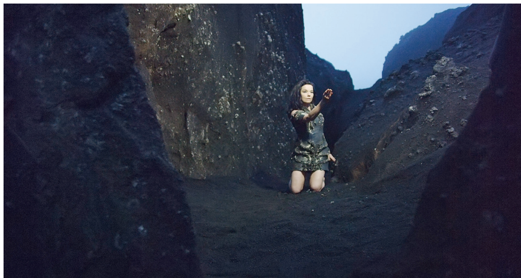
Photographie tirée du vidéoclip de « Black Lake » ( Vulnicura , 2015).