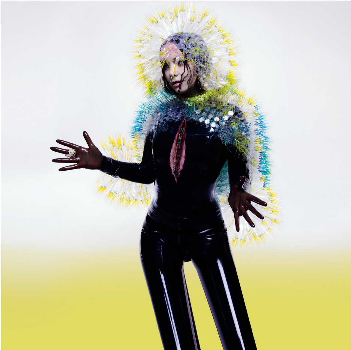
Couverture de l'album Vulnicura (2015).