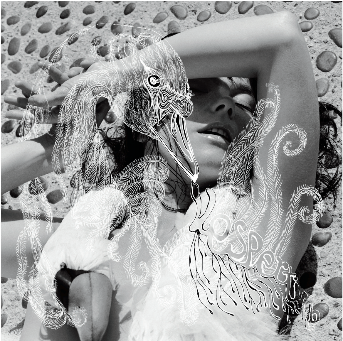
Couverture de l'album Vespertine (2001).