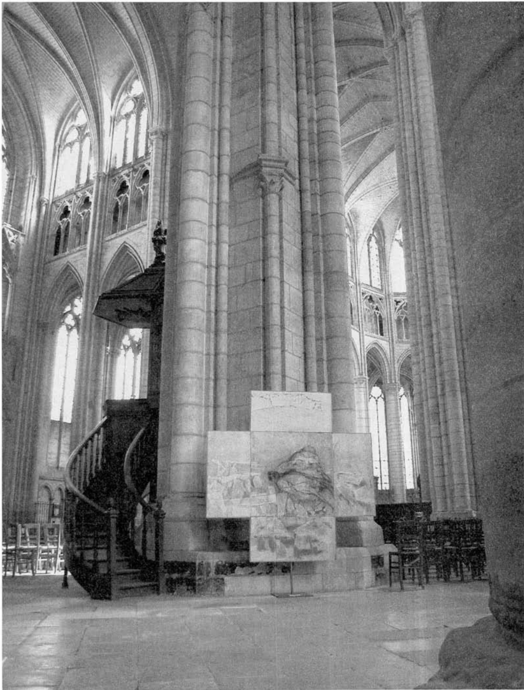
Michel Madore, La Pietà .