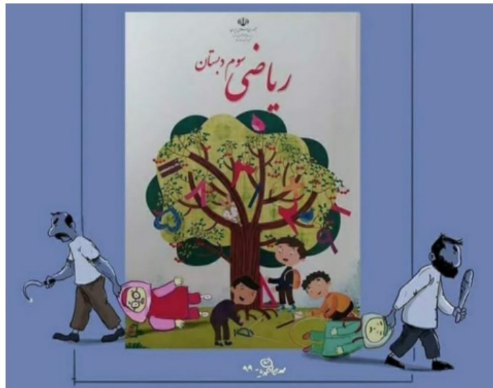
Illustration journalistique réalisée par Mahdi Ahmadian

Note. Illustration journalistique réalisée par Mahdi Ahmadian en réaction à la suppression des filles de la couverture d'un manuel scolaire de mathématiques par le ministère de l'Éducation en Iran. Illustration de Ahmadian, M. [@Mahdi_Ahmadian]. (2020, 10 septembre) [Tweet]. Twitter. (Tirée de Esfandiari, 2020)