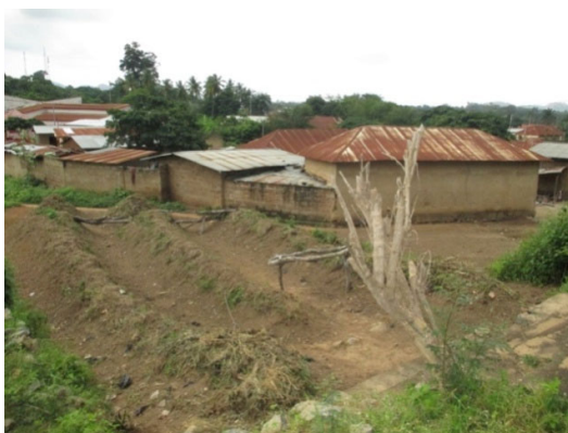
Figure 2 : Les trois sillons sacrés