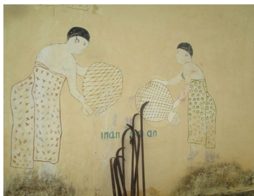
Figure 3 : Lieu de rituel des reines