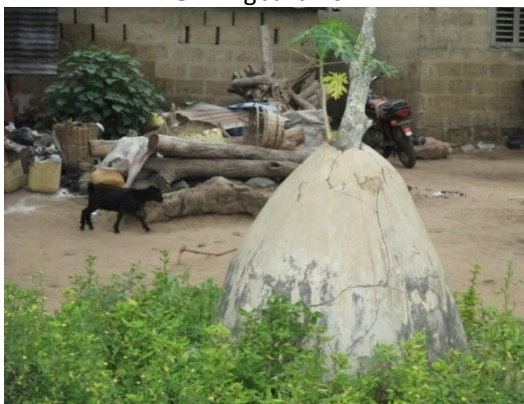
Figure 5 : site sacré du « Oossa »