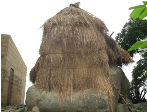
Figure 6 : case rituelle de JagouOgoudou

En guise de contribution, les femmes sont chargées quelques semaines avant la cérémonie de « Ilé ti toché » de la responsabilité de nourrir ceux qui vont travailler à recouvrir les toits. Le procédé du choix des femmes devant assumer la restauration s'appelle « Assériran », qui pourrait se traduire par « commande de mets ». Les dignitaires prennent quelques ingrédients du mets à commander et les apportent aux différentes personnes choisies. C'est ainsi que lorsqu'une personne reçoit quelques grains de maïs et qu'on lui dit « Aran è l'assé » (« tu as été choisie pour la restauration »), elle comprend qu'elle doit cuisiner un mets à base de maïs (akassa, pâte de maïs, etc.) pour la cérémonie. La stratégie du « Assériran » est un système traditionnel d'entraide pour mettre en œuvre efficacement les événements concernant toute la communauté. En réalité, la personne qui reçoit la mission du « Assériran » ne s'en charge pas seule, elle se réfère à toute sa famille et à ses proches pour obtenir leur contribution.