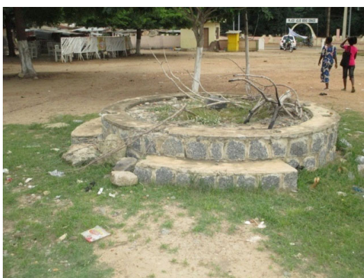
Figure 4 : « Idiwè Oyé », lieu où sont pratiqués les rituels de purification pour l'intronisation du roi ou des dignitaires