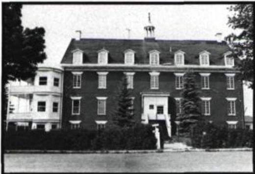
L'Écho du Nord

Le vieux couvent de Saint-Benoît de Mirabel