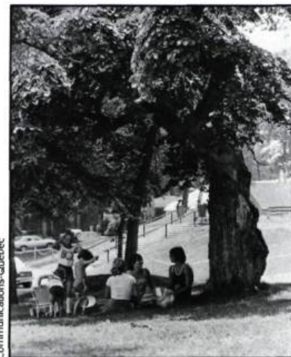
Lieux de rencontre et de quiétude, les espaces verts réduisent les effets du stress urbain et accroissent le bien-être psychologique des usagers.

Un rapide constat de la situation actuelle du patrimoine vert dans le milieu bâti révèle en premier lieu l'implication de nombreux intervenants en matière de protection et de mise en valeur de cette ressource naturelle. De plus en plus, des efforts louables sont déployés et des sommes d'argent appréciables commencent à être investies dans la gestion de la végétation. Toutefois, les résultats escomptés se font attendre. On assiste même, dans cer-