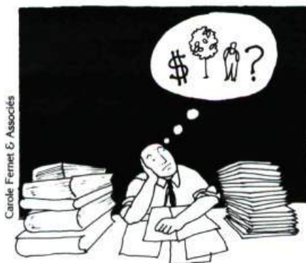
Les coûts, le choix des espèces végétales et le type d'intervention sont les préoccupations constantes du gestionnaire de la municipalité. Elles lui confèrent le pouvoir d'agir sur la qualité du milieu de vie des citoyens.

3° À partir de ce constat de la situation, la municipalité peut procéder à l' élaboration du plan de gestion de la végétation. Ce plan consiste à déterminer ses objectifs à court, moyen et long terme, de même que les différents moyens envisagés pour y parvenir. Cette démarche est essentielle pour que les actions s'articulent de façon cohérente et fonctionnelle. Les interventions ponctuelles et hors contexte sont ainsi évitées.