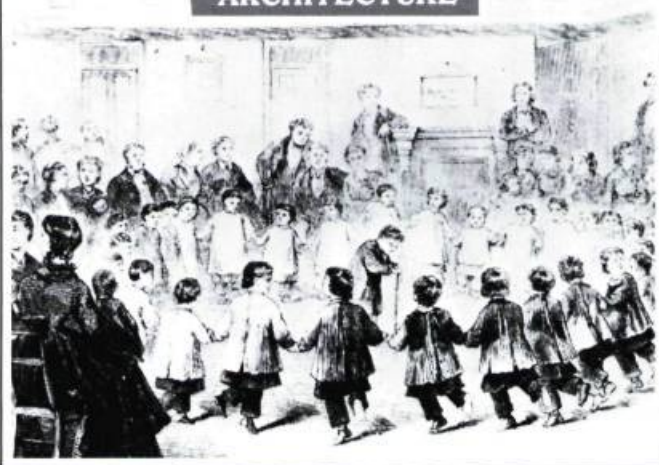
La garderie collective de la communauté d'Oneida aux États-Unis (Tiré de Franck Leslie's Illustrated News , Avril 1870).

À la même époque se font aux États-Unis d'innombrables clubs coopératifs tandis qu'en Europe apparaissent les premières cités-jardins. Cette effervescence sociale et cette volonté de transformer la maison se heurtera au début du