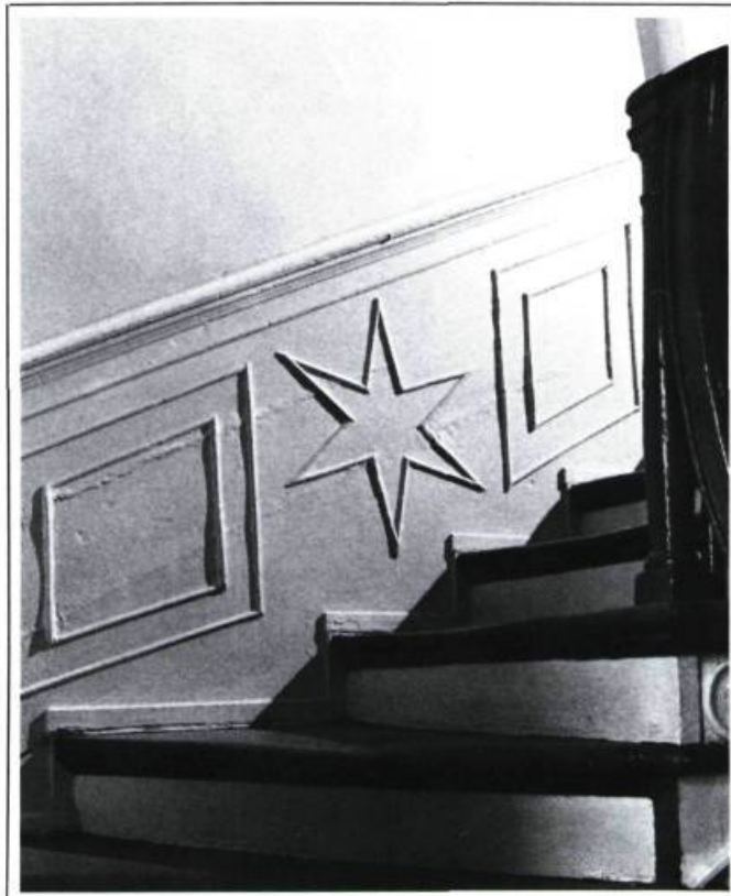
Lambris à mi-hauteur ornant l'escalier de la maison Leboeuf (ca 1780).

L'ornementation dans la maison urbaine du Régime français se compose principalement d'ouvrages de menuiserie. Panneaux soulevés, chantournements symétriques, chanfreins aux noyaux des escaliers, aux traverses des vantaux et aux allèges des croisées, sont l'oeuvre de maîtres menuisiers. Bien qu'importants, les ouvrages de pierre qui reçoivent une ornementation sont plus rares. De plus, les ornements des divers éléments architecturaux sont isolés les uns des autres, leur effet est ponctuel. En ce qui touche la conception, il n'existe aucune vision d'ensemble au plan de l'ornementation d'une