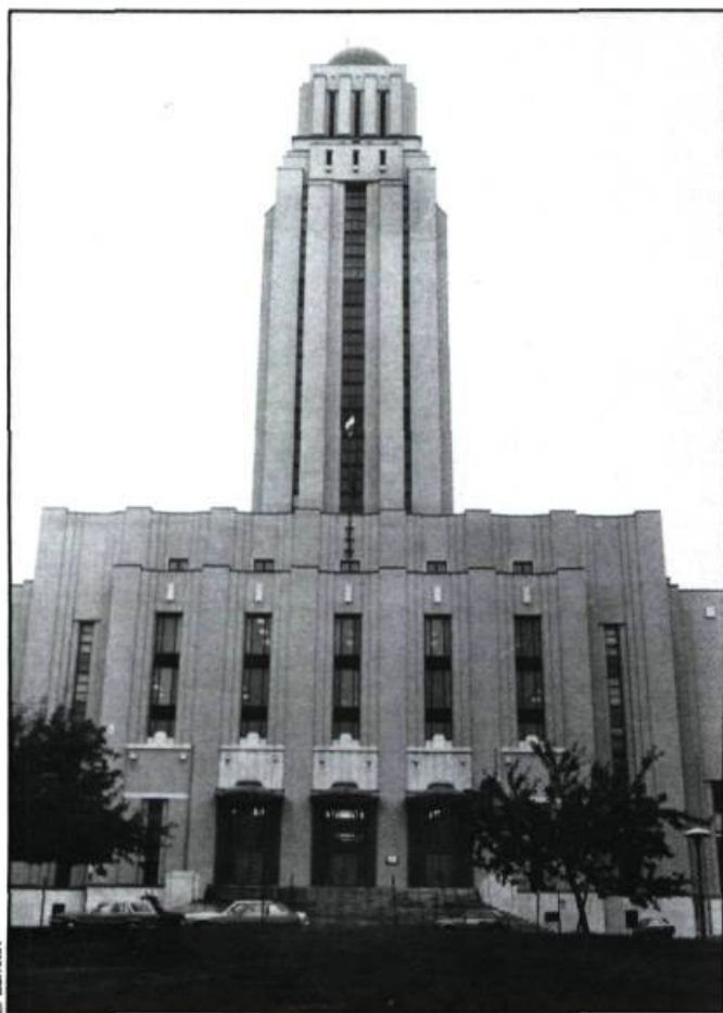
L'entrée principale de l'Université de Montréal, «...l'image de l'ordre dans tous les sens de ce terme».

à sa forme et à sa fonction. La décoration ou l'ornementation architecturale, cependant, renvoie à tout ajout non essentiel à l'aménagement de l'espace, mais combien responsable de «l'image» du style, dont il est en quelque sorte l'index. Or, l'ornementation demeure polyvalente