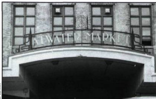
Le Marché Atwater de Montréal, détail de l'entrée principale: «Le motif de fer noir... ouvre et clôt l'énoncé sur un seul signifié, soit la décoration dont découlent les connotations suivantes: élégance, surplus, abondance».

L'édifice de l'université de Montréal, qualifié d'Art déco,