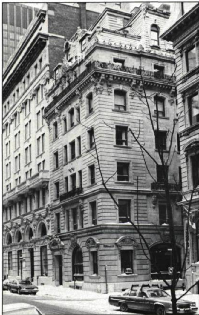
D'inspiration Second Empire, le London and Lancashire Life Building (244, rue Saint-Jacques) offre un décor exubérant mais cohérent.