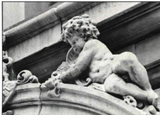
Un détail du décor ornant l'entrée du London and Lancashire Life Building.

des années 1920. D'une rare sobriété, l'ornementation signale le caractère fonctionnel de l'édifice; elle confère un certain rythme à la façade et rompt la monotonie des plans verticaux et lisses du calcaire et du granit. Feuilles avec lemnisques, panneaux décorés de couronnes de feuilles, banderoles et cartouches : ces divers éléments appliqués en à-plat pour donner une impression de décor continu, ne se concentrent en fait qu'en des points particuliers et permettent d'éviter que le bâtiment ait un caractère froid. Portiques, succession des registres, angles et corniches, forment un ensemble qui contribue à animer l'espace, avec toutefois cette réserve typique des années 1920. À cause de leur sobriété, les décors s'isolent de la structure et nous permettent de les apprécier dans le détail. Il est regrettable que les propriétaires de l'édifice n'aient pas encore songé à faire ravalier les façades afin de mettre en évidence la beauté de la pierre.