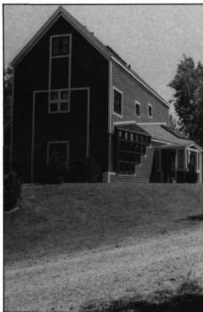
La maison Desourdy à Bromont, des architectes Cayouette et Saïa, rappelle les formes de la maison de bois sciée des Cantons de l'Est.

On peut par ailleurs subdiviser l'historicisme post-moderne en deux groupes. Un premier type cherche dans l'histoire une source d'enrichissement, de plus grande qualité. Cet historicisme post-moderne est celui de la compréhension des solutions antérieures, de l'analyse de leur raffinement et de la réflexion sur la continuité. Il s'exprime par des allusions, des connotations historiques, qui n'entrent pas dans la composition mélodique, mais restent au niveau des harmonies de l'orchestration. Il en résulte des oeuvres modernes moins dogmatiques ou moins primaires. À titre d'exemple, on peut citer la maison Desourdy (voir photo de la page couverture), réalisée à Bromont par les architectes Cayouette et Saïa. Ses réminiscences de l'architecture régionale n'épuisent pas sa valeur, qui tient autant à la qualité de sa recherche spatiale.