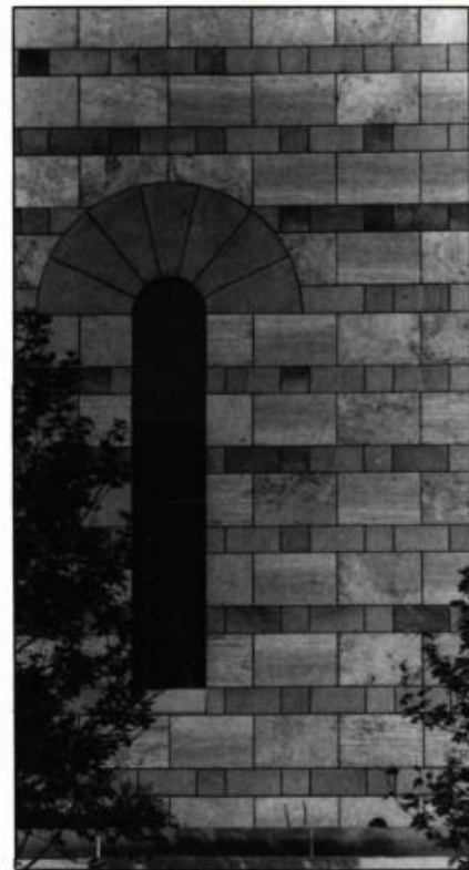
Détails de la New Staatsgalerie à Stuttgart en Allemagne de l'ouest, des architectes anglais James Stirling, Michael Wilford et Associés. La maçonnerie faite de grès et de travertine non poli et l'ordre rigoureux des galeries, confèrent au Musée un caractère classique et monumental avec lequel contraste plusieurs éléments informels: l'absence de joints de maçonnerie, les rampes et structures de métal constructivistes aux couleurs vives. Ce musée a été apprécié tant par les résidents que les critiques d'art et d'architecture qui lui ont consacré nombre d'articles.