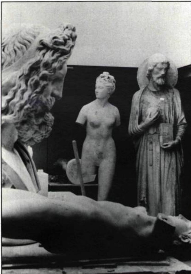
La collection des moulages de plâtre de l'ancienne École des Beaux-Arts de Québec ne connaît pas d'équivalent au Canada. En 1962, le nombre de pièces atteignait 4000.

d'ordre esthétique en raison de la valeur intrinsèque des chefs-d'œuvre copiés, mais elle tient également au contenu didactique évident de la collection. La collection de moulages constitue un corpus fort riche pour notre jeune patrimoine artistique. Plusieurs artistes du Québec d'aujourd'hui n'en sont-ils d'ailleurs pas les héritiers? Cette appréhension du passé, qui s'inscrit au cœur des dé-