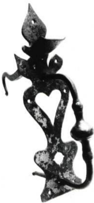
Loquet poucier en laiton coulé, fin XIX e siècle. La maîtrise technologique a permis la finesse de ce relief poli qui se découpe sur un fond grené. Hauteur 24 cm.