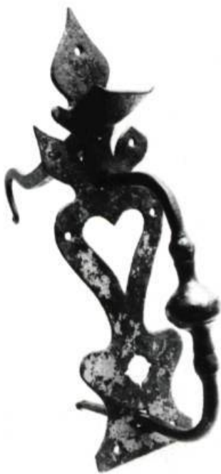
Loquet pousier en laiton coulé, fin XIX e siècle. La maîtrise technologique a permis la finesse de ce relief poli qui se découpe sur un fond grené. Hauteur 24 cm.