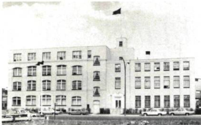
Aspect ancien de l'ensemble de la Johnson & Johnson. La partie du centre aurait été haussée en 1927 et en 1936, la partie où se trouve l'entrée aurait été ajoutée.

Pour une compagnie internationale, le prestige relié à son emplacement constitue un argument majeur dans sa prise de décision. Si la Johnson & Johnson n'a pas opté pour un retour en ville, sa décision illustre toutefois ce regard nouveau porté sur le caractère culturel et historique de la ville. Ainsi, l'aspect fragmenté du quartier Hochelaga-Maisonneuve où les manufactures, les habitations et les monuments Beaux-Arts 1 se côtoient, ne rebute plus. Au contraire, l'unique, l'inusité et le banal s'amalgament pour former un quartier pittoresque et original. Par ailleurs, l'histoire devient le thème intégrateur de ce jeu des différences. Dès la fin du XIX e siècle, l'ambition des promoteurs était d'ériger une ville industrielle prospère et prestigieuse. En choisissant d'y rester, Johnson & Johnson rappelle le contexte de son implantation dans Maisonneuve, peu après l'annexion du quartier à Montréal, et contribue activement à en perpétuer le sens et le caractère.