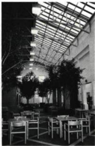
La cafétéria, largement éclairée par une verrière.

C'est la partie arrière qui démontre la recherche architecturale la plus articulée; le dynamisme de sa conception est remarquable. Les matériaux multiples, les traitements rythmiques variés, ainsi que les différents volumes imbriqués les uns dans les autres, révèlent une architecture complexe et contradictoire, à l'image de l'idéal post-moderniste que poursuivent Cayouette et Saïa.