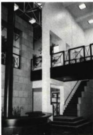
Le hall, situé dans le nouvel édifice.

La décision la plus importante touche la démolition du pavillon central. Cet édifice résultant de modifications successives, posait des problèmes de circulation et offrait peu d'intérêt selon les architectes. À sa place, ils ont créé une cour centrale et construit deux nouvelles parties: une en façade et une autre, nettement plus importante, à l'arrière, qui sert d'entrée principale. La