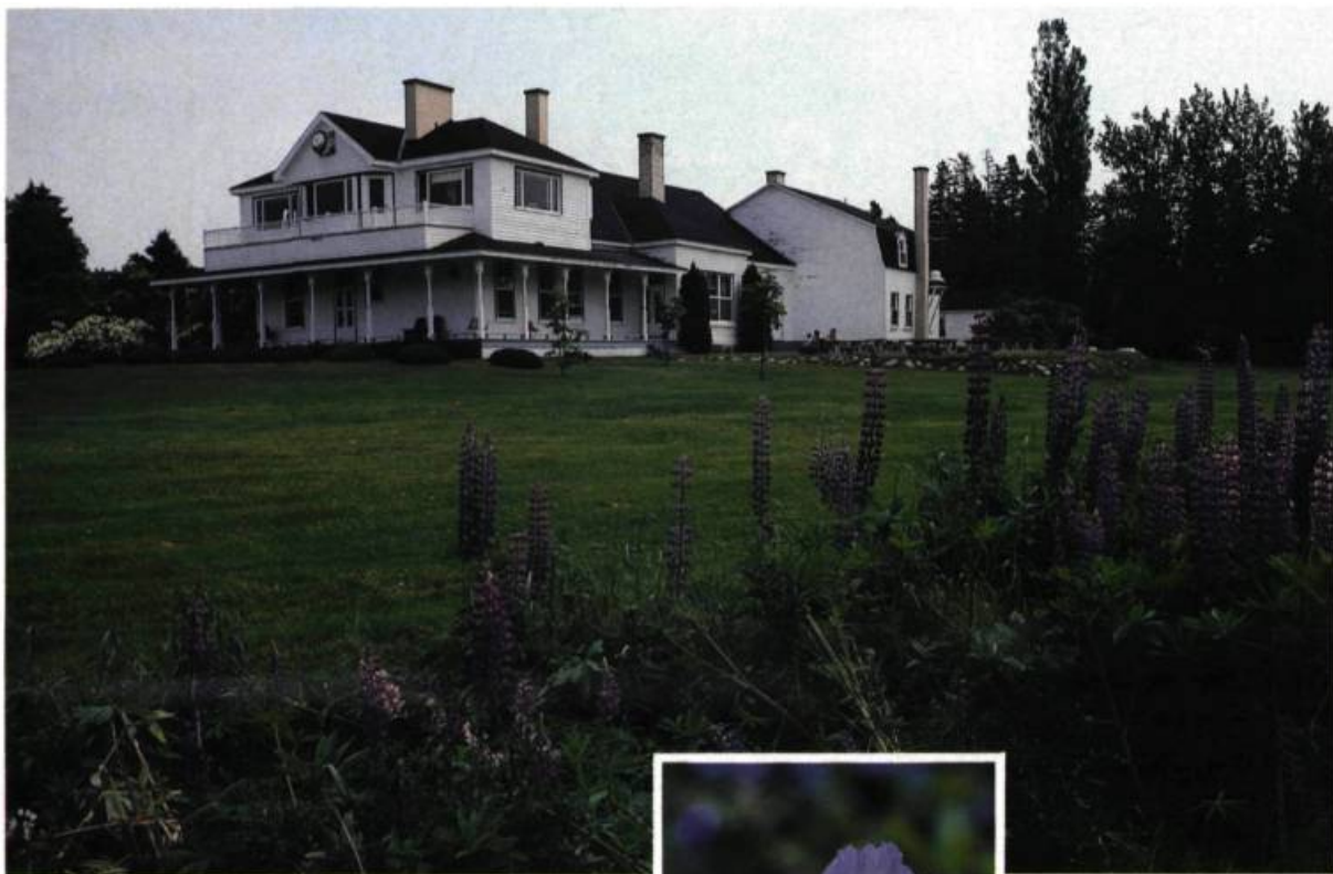
La villa Reford sert à l'interprétation de l'histoire et la culture de la région de Métis. On peut s'y restaurer tout en profitant d'un décor enchanteur et hospitalier.