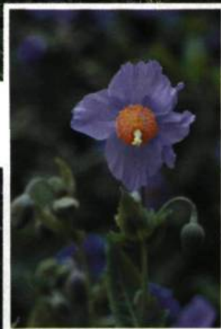
Originaire des prairies alpines de l'Himalaya, le pavot bleu a été introduit dans les jardins par Mme Reford. Cette plante, très difficile à cultiver, fait la fierté des Jardins de Métis dont elle est devenue l'emblème floral.