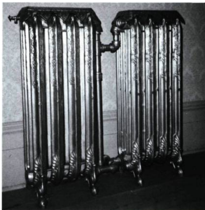
Bel exemple de calorifères décoratifs bien conservés et mis en valeur dans une ancienne propriété convertie en musée.

Parmi les principales composantes d'un système de