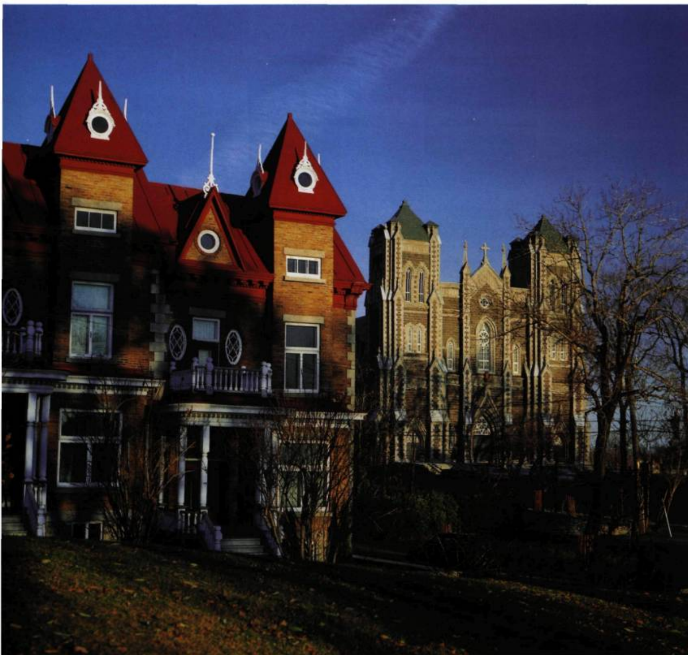
Sous le signe de l'éclectisme: les maisons en rangée de la rue du Couvent.