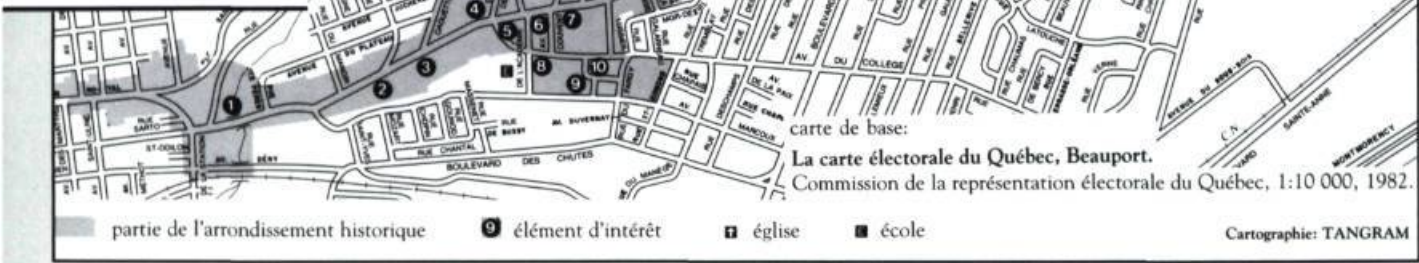
carte de base: La carte électorale du Québec, Beauport. Commission de la représentation électorale du Québec, 1:10 000, 1982.

partie de l'arrondissement historique 9 élément d'intérêt ☩ église ■ école Cartographie: TANGRAM