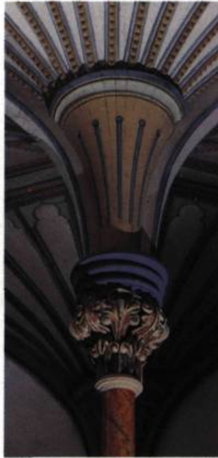
Un chapiteau et le départ d'une voûte en éventail.

Contrairement aux chapelles extérieures bien connues (celles des Ursulines, de l'Hôtel-Dieu ou du séminaire de Québec, par exemple) qui adoptent le plan ou la forme d'une église, la chapelle du couvent d'Ottawa s'inscrit dans un corps de bâtiment; elle y occupe les premier et deuxième étages, le rez-de-chaussée étant aménagé en salle de musique et le comble mansardé en dortoir. Afin de créer des espaces intérieurs bien dégagés, l'architecte utilise des colonnes pour soutenir les lambourdes de plancher. Cette disposition, employée une première fois par Thomas Baillairgé dans la chapelle de la Congrégation du séminaire de Québec en 1821, constitue à chaque étage un vaisseau principal et deux collatéraux de même hauteur, laissant ouverte toute possibilité de cloisonnement ultérieur. Emprunté à l'architecture commerciale, ce système se raffine avec l'avènement des colonnes de fonte et les structures de planchers de bois enduits: les portées plus grandes sont possibles et la protection contre le feu est accrue.