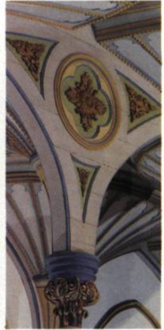
Le décor des écoinçons des voûtes.