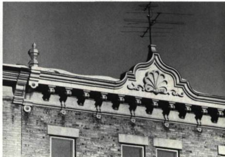
Dans le cas d'un bâtiment à toit plat, la corniche protège les parties sous-jacentes des intempéries et est souvent le seul élément ornemental de la façade.

La corniche étant un élément important de la composition d'une façade, il faut tenir compte de sa valeur et de son rôle lorsqu'on la remplace en tout ou en partie. La plupart des ferblantiers et des menuisiers peuvent facilement reproduire les moulures simples, en tôle ou en bois, ou fabriquer des modèles similaires. Certains ateliers de menuiserie ou de ferblanterie confectionnent des corniches de remplacement plus élaborées. Il se fait également des moulages en matière plastique, ce qui permet de répéter un motif particulier. Certaines compagnies spécialisées en produits pour la rénovation offrent aussi des modèles conviviaux.