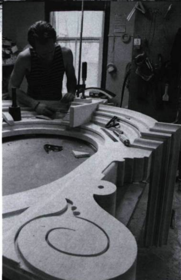
Le chambranle d'une lucarne de la façade dans l'atelier de sculpture sur bois Paul Don à Montréal.

transformation d'un immeuble résidentiel en édifice public. Il évoque les contraintes imposées par le fait que Shaughnessy doit non seulement être restaurée mais aussi recyclée: si au rez-de-chaussée on conserve en partie les pièces originelles (salons et salles à manger), les étages seront réaménagés en locaux administratifs. Sans compter les mauvaises surprises: murs de pierre au mortier effrité; solives d'une portée de six mètres qui ont entraîné d'importantes déformations au niveau des planchers. Tout cela ajouté aux effets de l'occupation et du vandalisme.