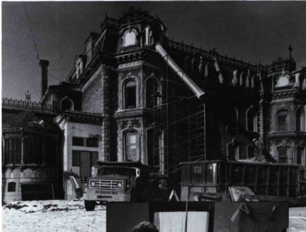
La façade sud et sa profusion d'ornements en cours de restauration. À gauche, la petite serre de la maison ouest.