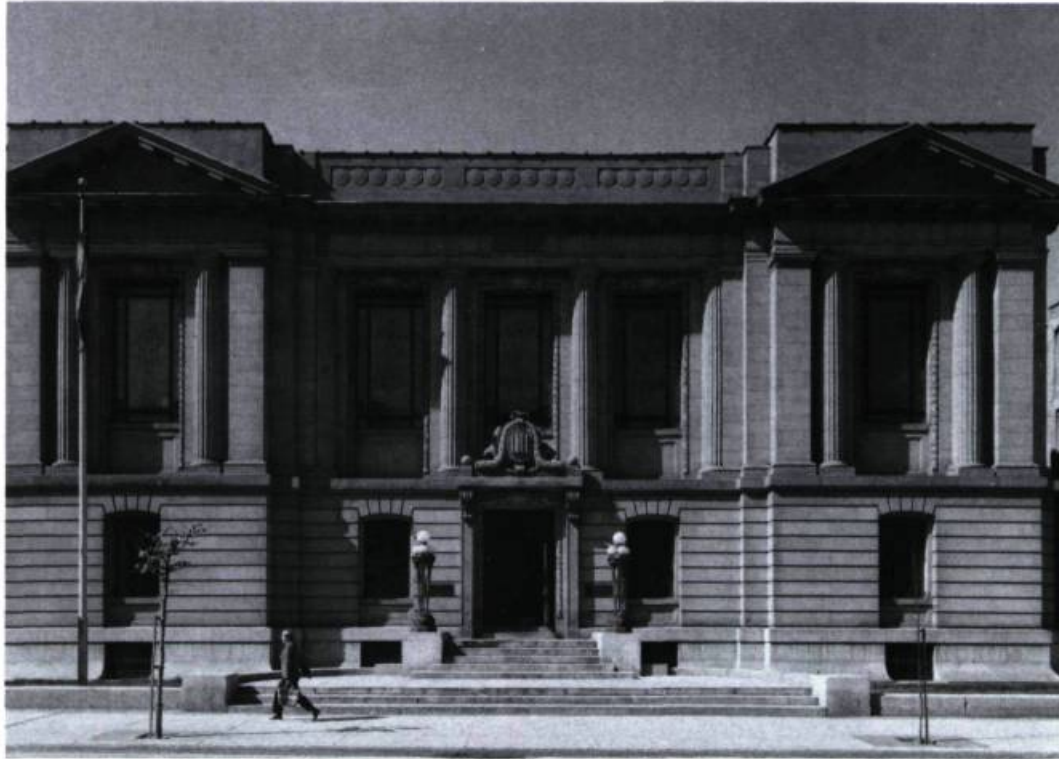
L'image de marque de l'institution: la façade sur la rue Saint-Denis.