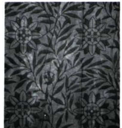
Papier floral (v. 1880) de même inspiration que ceux que dessinait l'Anglais William Morris (1834-1896). Violet sur fond beige. Provenance: îlot Saint-Nicolas, sur un mur de plâtre.

Restaurateur d'objets anciens au Service canadien des parcs.