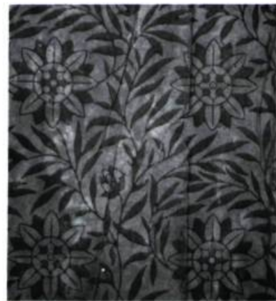
Papier floral (v. 1880) de même inspiration que ceux que dessinait l'Anglais William Morris (1834-1896). Violet sur fond beige. Provenance: îlot Saint-Nicolas, sur un mur de plâtre.

Restaurateur d'objets anciens au Service canadien des parcs.