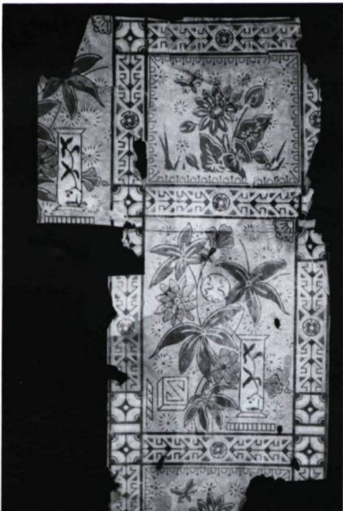
Fragment de motif japonais (v. 1880), bel exemple de l'influence orientale. Utilisé surtout dans les halls d'entrée et les cages d'escalier. Motif floral vert avocat, ocre et orange cerné de lignes noires sur fond vert pâle. Provenance: une maison de la côte du Palais, sur un mur de plâtre.

Avant et pendant les travaux de restauration ou de démolition d'un bâtiment ancien, on doit faire une recherche sur les papiers qui se trouvent encore sur les murs. Il se peut toutefois qu'ils soient dissimulés dans la structure d'une nouvelle cloison. Il faut alors vérifier tous les ajouts et les moindres surfaces sous les chambranles de portes, dans les placards, derrière les calorifères. On recommande de faire un plan des murs et de coder les fragments qui s'apparentent à ceux qu'on a déjà trouvés. Même les plus petites parcelles peuvent se révéler utiles.