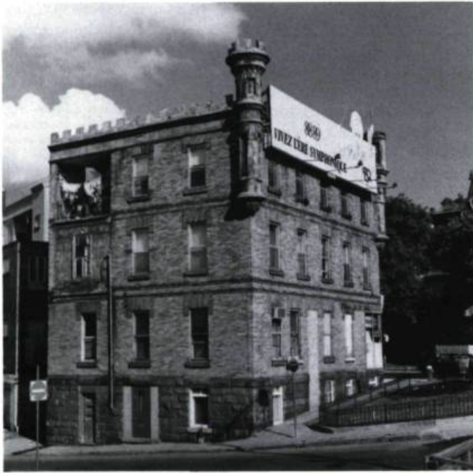
La maison Parent à l'angle des rues Saint-Jean et D'Aiguillon à Québec (Georges Bussière arch., 1898). Il lui manque aujourd'hui une de ses tourelles.