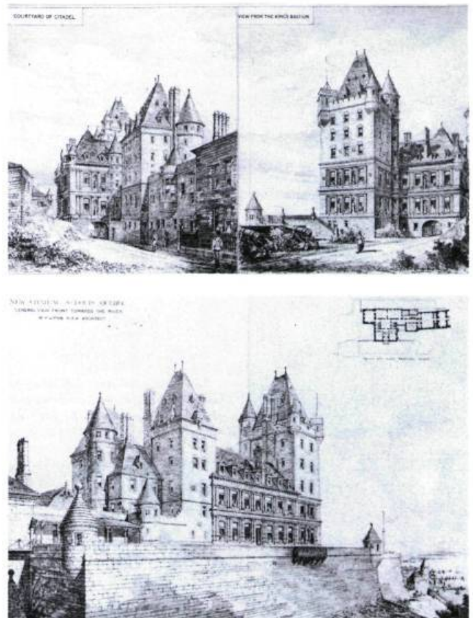
Les projets de Lord Dufferin et de son architecte W. H. Lynn auront servi de point de départ à toute une série de réalisations de style forteresse par des architectes de Québec. (Deux des projets de l'architecte Lynn publiés dans The Building News de Londres, le 25 octobre 1878: un bâtiment dans la cour de la citadelle et le château Saint-Louis.)

L'assimilation partielle par Charest de l'architecture néo-médiévale n'a pas seulement produit ses effets sur le vocabulaire. La même ambiguïté pèse sur les articulations des bâtiments, si on les rapporte aux principes d'un néo-médiévisme plus «orthodoxe». Depuis ses origines, anglo-saxonnes (Pugin, Ruskin) ou françaises (Viollet-le-Duc), celui-ci a toujours eu partie liée avec les choix pittoresques. Que l'irrégularité de la compo-