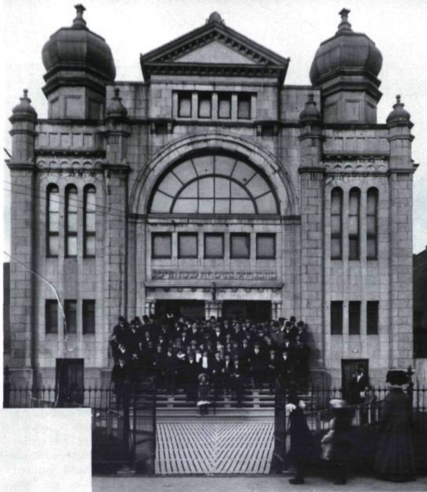
La synagogue Chevrá Kadisha (polonaise), rue Saint-Urbain, fut incendiée en 1920.