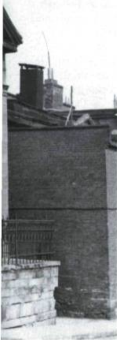
La deuxième synagogue Shearith Israël (Spanish-Portuguese), rue Chenneville, a été construite en 1838. On la voit ici en 1938, quelques années avant sa démolition.

conquête fut plus hâtive, on note à l'automne 1759 le passage de Samuel Jacobs, armateur et commerçant, qui devait ouvrir un peu plus tard dans la vallée du Richelieu des magasins à l'intention des populations locales. Bientôt, d'autres familles juives commerçantes s'installent au pays, au point que la première congrégation de rite mosaïque est formée à Montréal en 1768. Nommée Shearith Israël, elle est mieux connue aujourd'hui sous le nom de «Spanish-Portuguese».