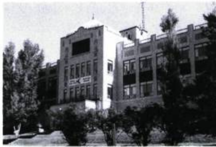
L'hôpital du Mont-Sinaï à Sainte-Agathe (1930, Spence et Goodman, arch.) remplace l'ancien sanatorium fondé en 1909.

La communauté juive est malgré tout solidement implantée à Sainte-Agathe et dans ses environs. Elle s'est établie aussi à