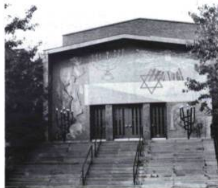
La synagogue Young Israel, rue Hillsdale, date de 1954.