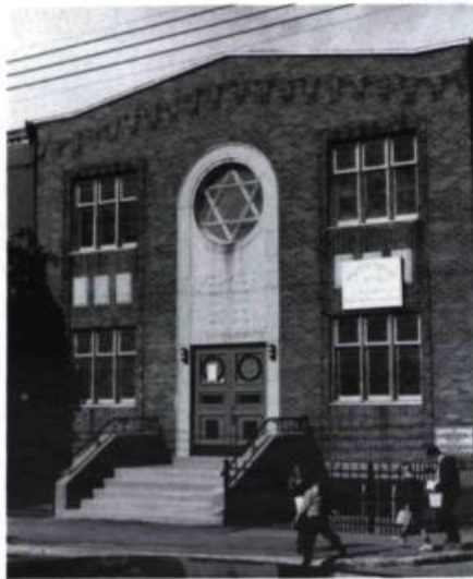
Rue Jeanne-Mance, la première synagogue construite après la guerre, en 1947.