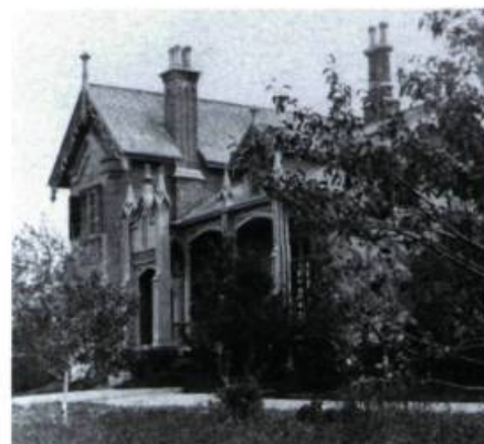
La villa Thornbury vers 1860, première résidence des sœurs des Saints-Noms-de-Jésus-et-de-Marie à Outremont.

Il ne reste malheureusement rien de leurs installations, mais les principales rues qui courent du sud au nord de la ville (Bloomfield, Wiseman, etc.) coïncident avec les limites de leurs terres qui constituent l'essentiel du territoire d'Outremont.