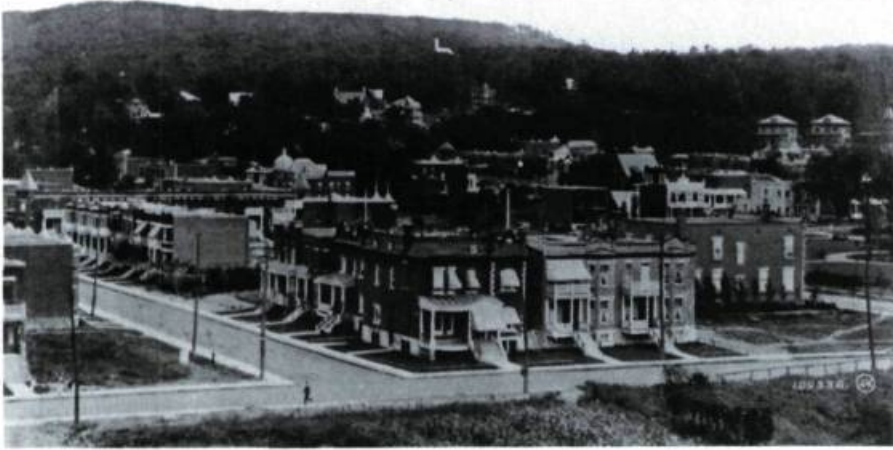
La ville d'Outremont et le mont Royal vus de l'avenue Saint-Viateur vers 1915.

Longue-Pointe à l'est, et du fleuve au sud à Saint-Laurent et à la Côte-Saint-Michel au nord, en excluant la ville de Montréal et le village de la Côte-Saint-Louis-du-Mile-End) plaçait désormais les destinées des résidents de la Côte-Sainte-Catherine sous l'égide d'un conseil siégeant à Saint-Henri. C'est finalement le 23 février 1875 que le gouvernement sanctionnait l'érection municipale du village d'Outremont où demeuraient moins de 300