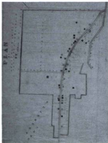
Territoire du "Village d'Outremont" en 1874. Plan de J. B. Morin. Archives de la Ville d'Outremont.