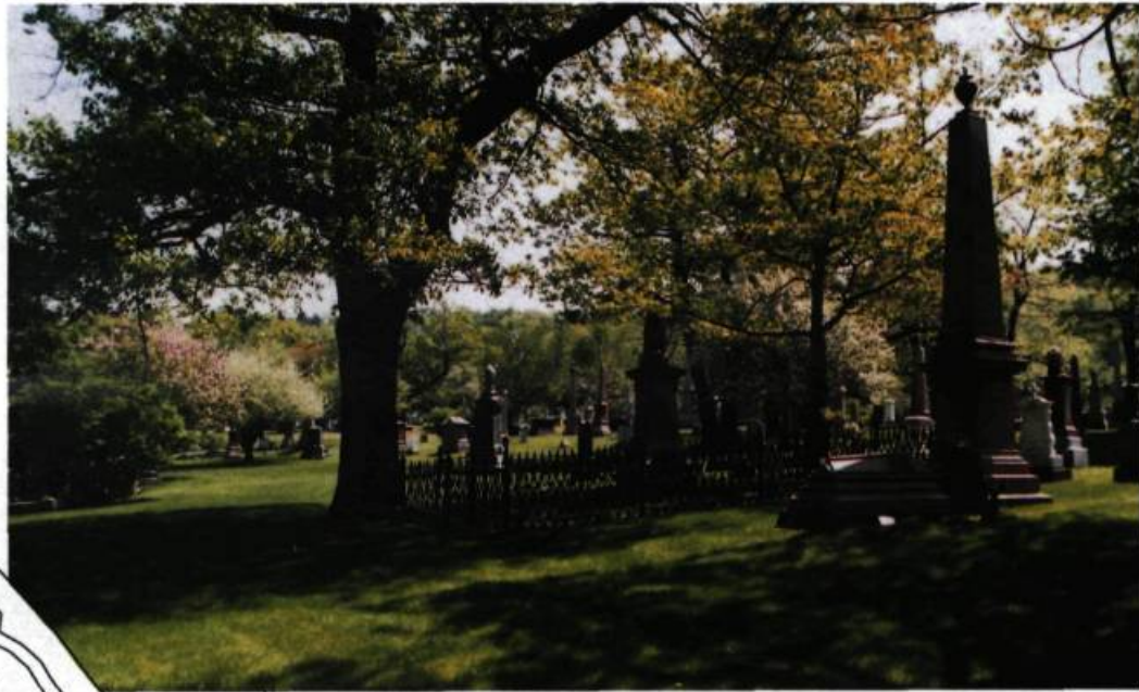
Vue générale du cimetière Mount Royal.

Contrairement à celui du chemin de la Côte-Sainte-Catherine, le tracé du boulevard du Mont-Royal ne découle pas logiquement des impératifs de la topographie, ni par ailleurs d'une quelconque vision urbaine. Il résulte du raccord de quatre tronçons. D'abord le "chemin du cimetière", ouvert entre 1850 et 1852 pour desservir la nécropole protestante;