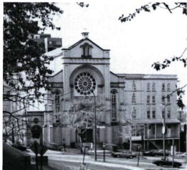
Couvent de Marie-Réparatrice, 1025, Mont-Royal (G.-A. Monette, arch.; 1911).