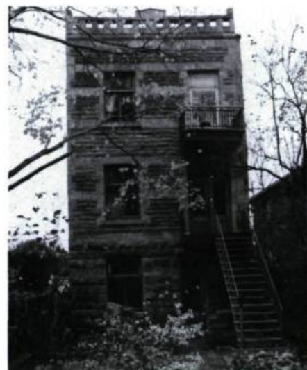
Triplex, 1229-1231, Mont-Royal (Asselin & Perron, arch.; 1905).