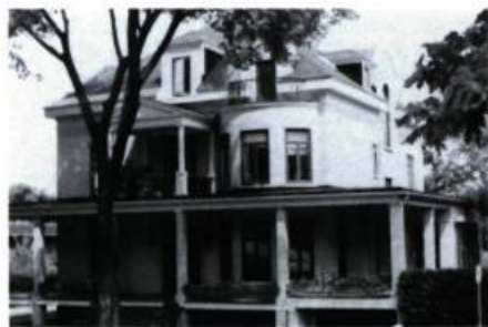
Maison I. Préfontaine, 22, Claude-Champagne (J.-L.-D. Lafrenière, arch.; 1916).

Le secteur en contrebas de la maison mère offre aussi quelques beaux exemples d'architecture domestique. En dévalant l'avenue Belœil, on notera spécialement