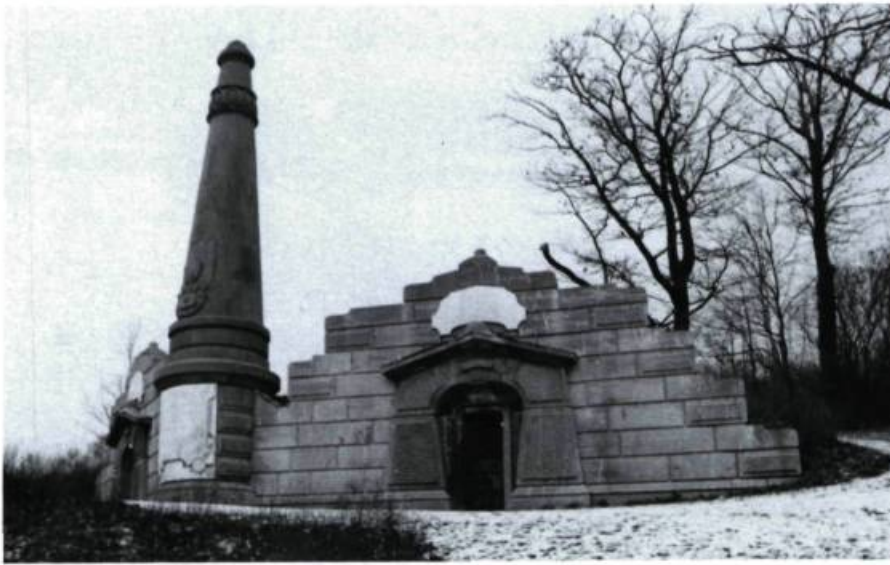
Caveau de la famille Molson (G. Browne, arch.; 1862).