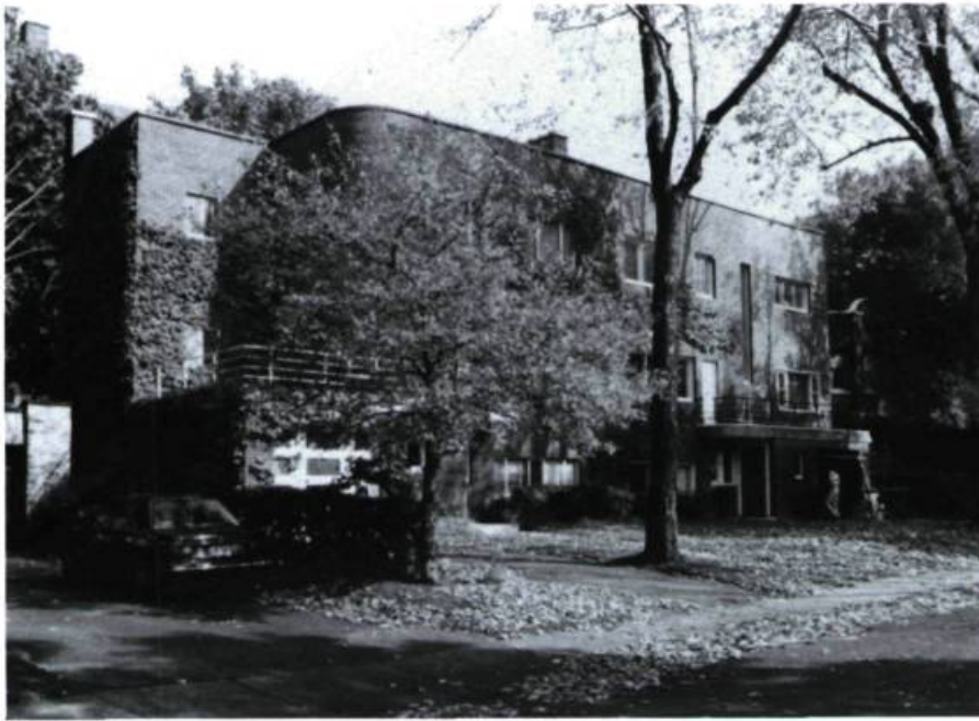
Jumelé J.-A. Jarry, 8-10, Glencoe (M. Parizeau, arch.; 1936).

percement du tunnel de la compagnie ferroviaire Canadian Northern (inauguré en 1912) qui passe sous la montagne et le parc de Vimy. La gare réclamée par les autorités municipales n'a jamais vu le jour, mais dans cette perspective et répondant au programme fédéral de relance de la construction résidentielle, la Ville a organisé en 1918 un concours d'architecture pour la réalisation de 12 maisons jumelées (51-53 et 50 à 80, avenue Kelvin, 53 et 59-61, avenue de Vimy et 25, avenue Robert; J.-R. Gadbois, arch.; 1919). Comme plusieurs des rues aménagées à cette époque, chacune des paires avait reçu un nom rappelant une bataille où les troupes canadiennes venaient de s'illustrer: Vimy, Louvain, Verdun, Cambrai, Ypres et Reims.