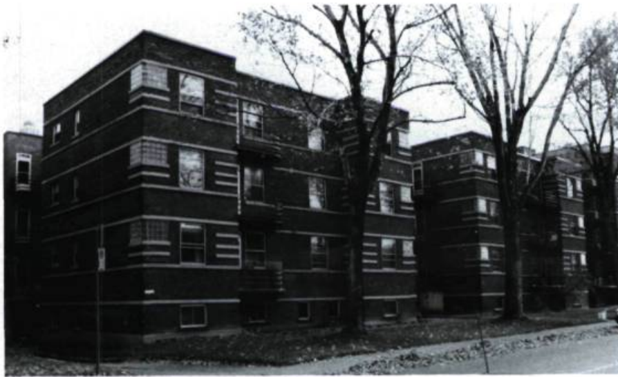
Immeuble résidentiel, 430, Willowdale (P. Colangelo, arch.; 1938).

Cet itinéraire est consacré à la visite du territoire qui s'étend à l'ouest de l'avenue Vincent-d'Indy et qui a été rattaché à la Côte-Sainte-Catherine au moment de son érection en village (1875) et même plus tard, à la suite de négociations avec la municipalité de la Côte-des-Neiges (1883).