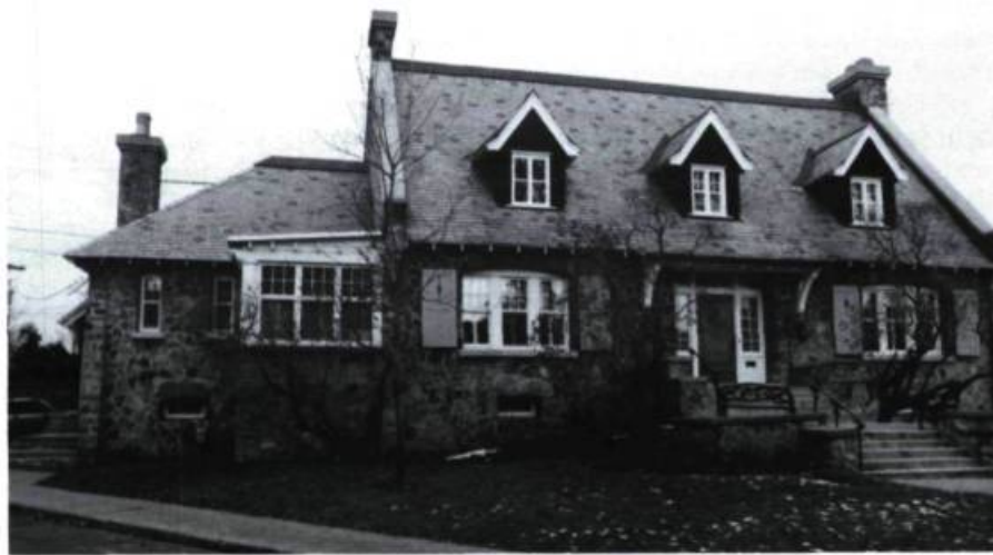
Jumelé, 58-60, Kelvin (J.-R. Gadbois, arch.; 1919). Photo: P.-R. Bisson et Ass.

En marge de cette série, on remarquera aussi la belle résidence E. H. Merrill (n° 26; Perry & Luke, arch.; 1927) qui marie les formes médiévales et classiques et se réfère autant à l'architecture des manoirs anglais qu'à celle de la tradition locale.