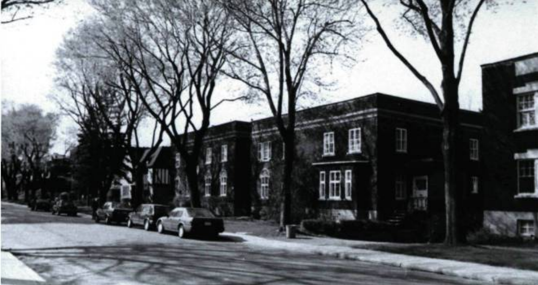
Maison L. G. Tarlton, 25, de la Brunante (H. S. Labelle, arch.; 1936).