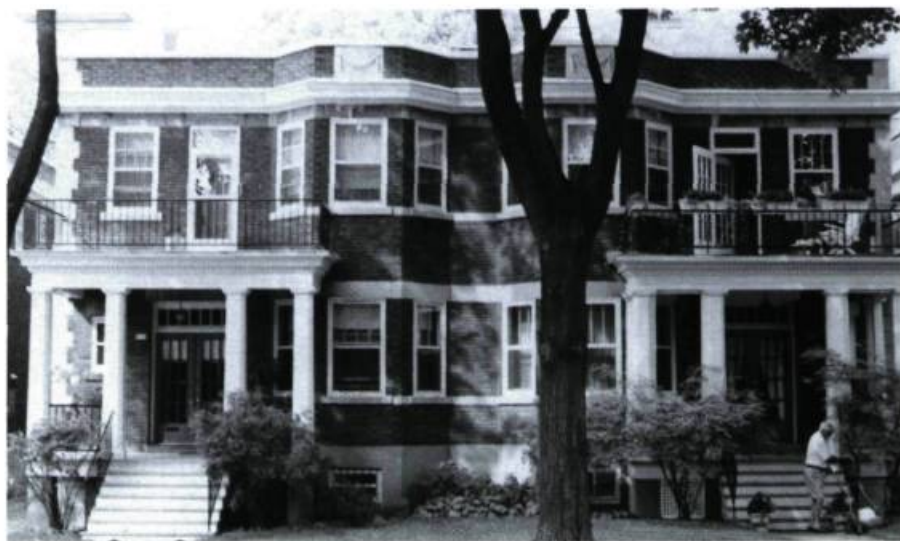
Maisons P. Guidazio, 38-40, Glencoe (Perrault & Gadbois, arch.; 1924).

galeries imposantes et choisissent un plan répété (n os 10 à 19; maisons jumelées R. Ironside; Ross & MacFarlane, arch.; 1910); celles au sud ont en revanche une géométrie plus simple, ne présentent pas de prolongements extérieurs et sont construites selon des plans inversés (n os 35 à 43; maisons de M me I. Bithell; Perrault & Gadbois, arch.; 1929; n os 36 à 44; maisons construites pour la compagnie Engineers & Builders Ltd; architecte inconnu; 1927). On notera que la différenciation des unités est plus poussée dans le cas des numéros 35 à 43, deux de ces maisons jumelées affichant des fausses mansardes et des pans de colombages inspirés du courant néo-Tudor.