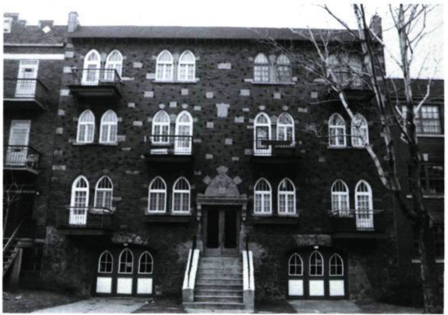
Immeuble résidentiel, 944, Davaar (Parent & Labelle, arch.; 1929).

Quelques manufactures et entrepôts subsistent qui présentent de réelles qualités architecturales et apparaissent d'autant plus précieux qu'ils sont rares à témoigner qu'Outremont n'a pas été qu'une banlieue-dortoir. Parmi les plus intéressants, on notera la manufacture de l'Osmose Wood Preserving Co. (n° 1080, Pratt; Perry & Day, arch.; 1945) où la pureté des lignes s'accorde à la blancheur du revêtement de stuc, celle de la Kraft Phoenix Cheese (n° 40, Bates; Perry & Luke, arch.; 1935) rehaussée de motifs Art déco, comme l'immeuble à bureaux construit en 1933 pour L. G. Tarlton par l'architecte Henri S. Labelle (n° 910-914, McEachran). Plus austères mais facilement recyclables, les immeubles fonctionnalistes à structures de béton apparentes édifés par l'entre-