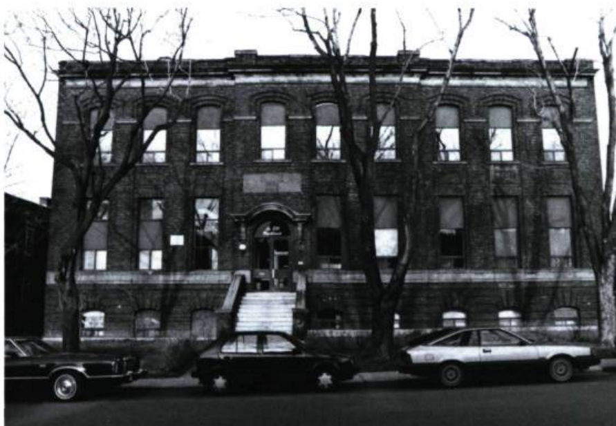
Ancien échangeur téléphonique de la compagnie Bell, 831, Rockland (W. J. Carmichael, arch.; 1912 et 1925).

De cet endroit, il est recommandé de revenir à l'avenue Van Horne en empruntant successivement les avenues Davaar, Ducharme et Rockland. Elles donnent un premier aperçu de l'architecture des triplex en rangée dont il sera surtout question dans l'itinéraire VIII mais permettent aussi de découvrir deux bâtiments étonnants. D'abord l'immeuble résidentiel conçu en 1929 pour la compagnie Sunny Sites Ltd, extrêmement curieux avec les garages de plain-pied, les balcons disposés en quinconce, l'appareillage moucheté, la fausse mansarde et surtout les fenêtres en arcs brisés empruntés au vocabulaire de l'architecture conventuelle (n° 944, Davaar; Parent & Labelle, arch.). Ensuite l'édifice que l'on pourrait facilement prendre pour une école, au 831 de l'avenue Rockland, qui a d'ailleurs servi au collège Stanislas de 1938 à 1942 et à la nouvelle école Saint-Germain dans les années 1960, mais qui a été conçu comme siège de l'échangeur téléphonique Atlantic de la compagnie Bell (William J. Carmichael, arch.; 1912 et 1925) et dont on pourra apprécier les beaux appareillages de brique.