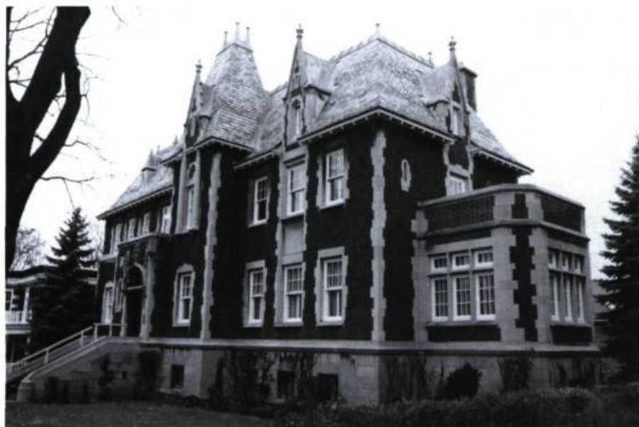
Ensemble résidentiel, 845-847, Pratt (Compagnie Bremner Norris; 1924-1926).