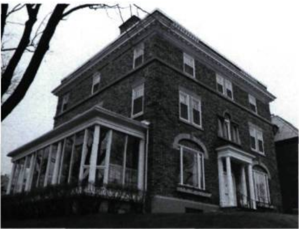
Maison C.-H. Branchaud, 636, Dunlop (Cox & Amos, arch.; 1913).