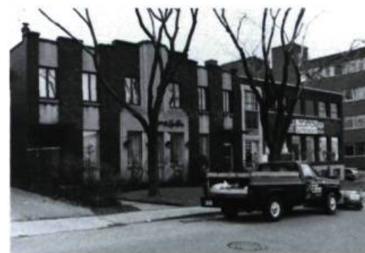
Perrault & Gadbois pour les entrepreneurs Guidazio & Besozzi (n° 815 à 857; 1923).