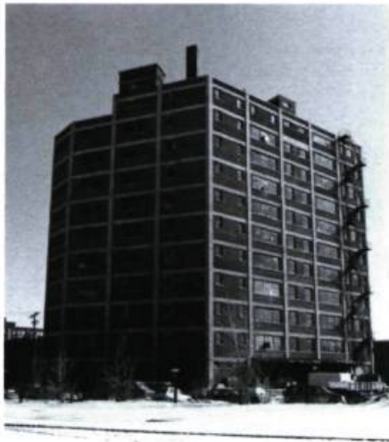
Ancien entrepôt de la Dominion Brass Co., 400, Atlantic (1919).

Ce dernier immeuble de 11 étages qui se trouve à l'extrémité nord-est de la ville, à l'extérieur du présent circuit, est néanmoins bien visible depuis la traverse Rockland (mise en chantier en 1966) où il faut monter pour apprécier l'étendue de la cour de triage promise à un prochain lotissement multifonctionnel.