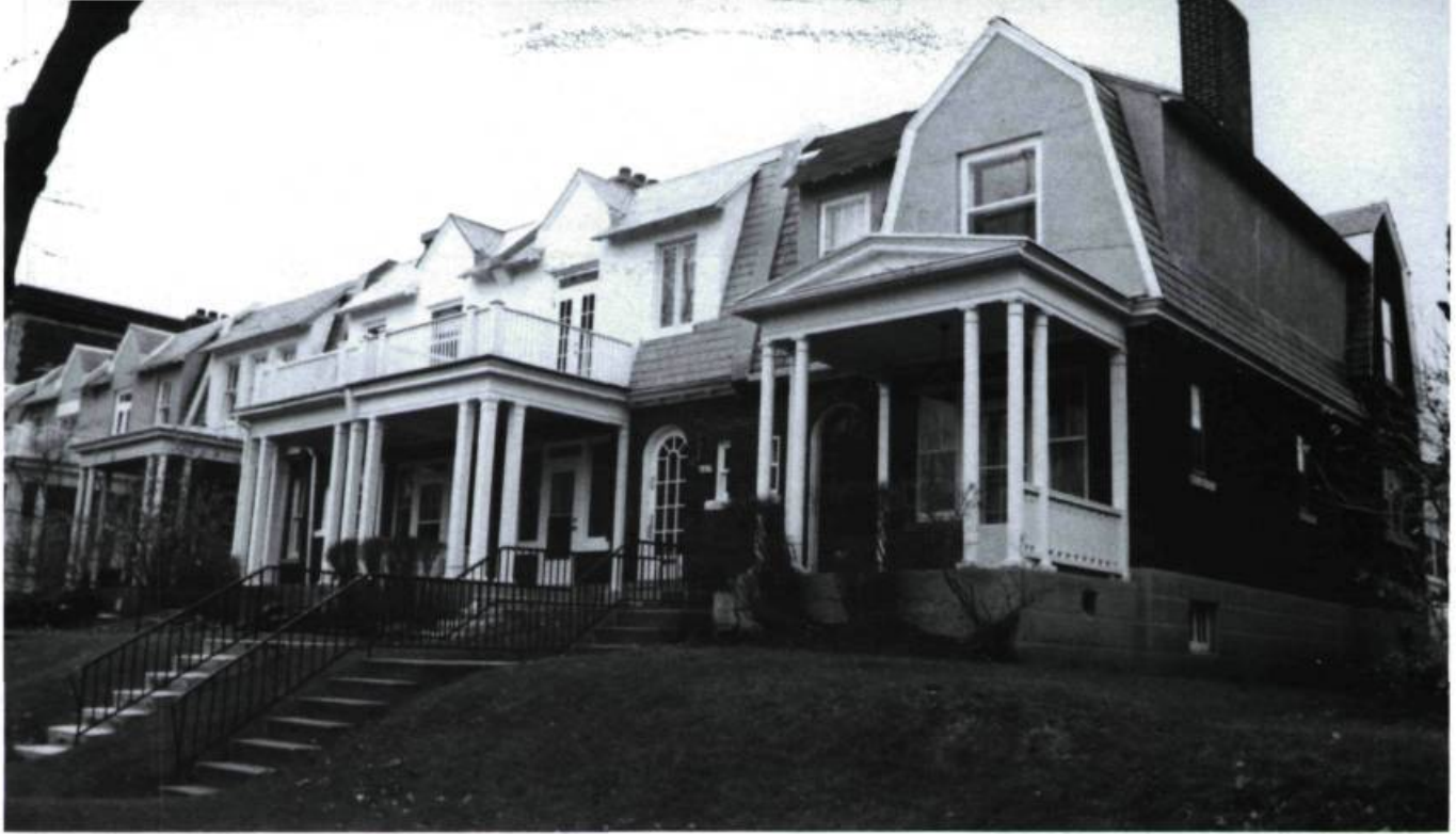
Maisons en rangée, 620-682, Stuart (Perrault & Gadbois, arch.; 1925).