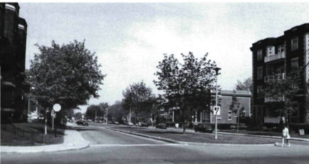
Vue du boulevard Dollard.