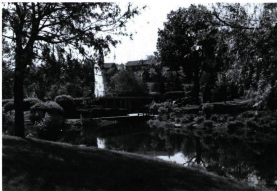
Parc Beaubien (J.-C. LaHaye & Ass., urbanistes et architectes paysagistes; 1978).

du chemin de la Côte-Sainte-Catherine, on notera encore deux habitations: celle du numéro 323 pour sa volumétrie curieuse, sa verticalité et sa superbe galerie ionique en retour d'équerre (maison O. Gratton; Gauthier & Daoust; 1912) et la dernière, au numéro 315, tant pour la chaude coloration orangée que pour l'appareillage de brique du parapet, empreint d'un médiévalisme que reprennent les bois sculptés en forme de gargouille, récemment ajoutés (maison Arthur Gaboury; architecte inconnu; 1909).