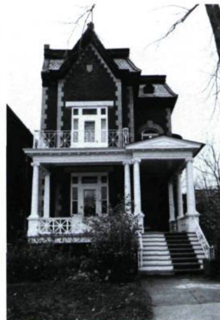
Maison O. Gratton, 323, Stuart (Gauthier & Daoust, arch.; 1912).

En face, le parc Beaubien, qui se distingue par un puissant jet d'eau, est à ce jour le dernier des grands espaces verts si caractéristiques de la ville. Il a été réalisé en 1978 par J.-C. LaHaye & Associés, urbanistes et architectes paysagistes, après que l'on eut écarté les projets de construction d'un nouvel hôtel de ville (1950) puis d'immeubles à logements multiples (1969).