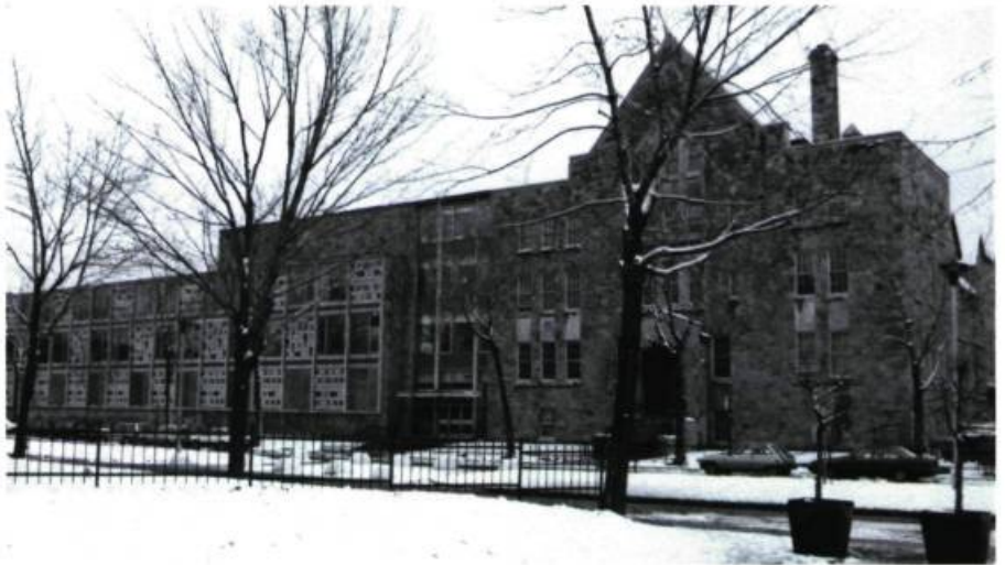
Collège Stanislas, 780, Dollard (Perrault & Gadbois, arch.; 1941).