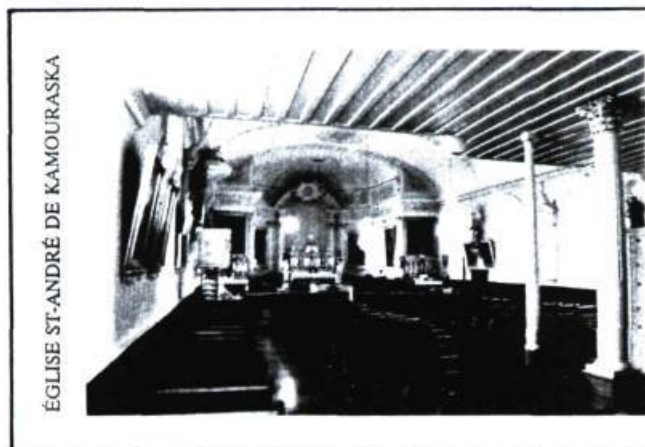
ÉGLISE ST-ANDRÉ DE KAMOURASKA