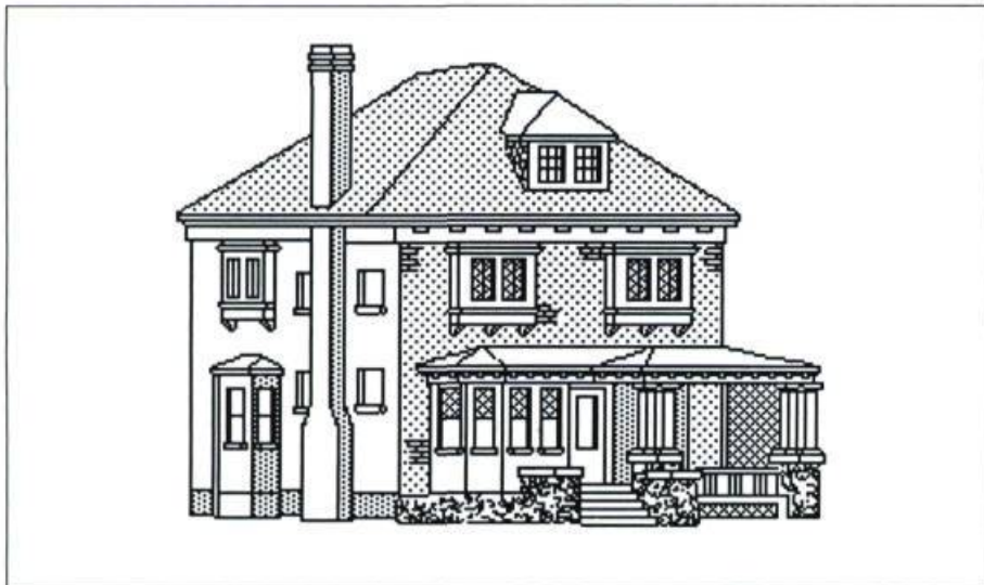
Schéma d'une maison vernaculaire avec toit en croupe: 243, boulevard Queen Nord, Sherbrooke. Infographie: Gaétan Bousquet, 1988.

La maison unifamiliale naît d'une rationalisation des formes en fonction des besoins modernes au tournant du XX e siècle, qui réduit la maison à une simple unité composée d'un rez-de-chaussée où tout est de plain-pied. Même si elle dérive indirectement de l'unifamiliale hindoue, celle du Nord-américain est somme toute un modèle réduit des villas californiennes au début du XX e siècle. Elle s'inscrit ensuite au sein d'un mouvement de construction d'habitations populaires nommé craftman (artisan-bricoleur). Des plans précis, issus pour leur part des premiers pattern books , sont mis en vente par des maisons spécialisées telles Alladin. Cette rationalisation marque un pas vers la normalisation, qui conduit à la fabrication usinée des années 70 ou au concept de modules évolutifs des années 90.