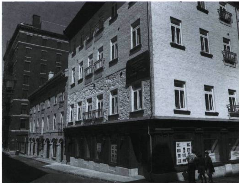
Extérieur de la maison Charles-Aubert-de la Chenaye après les rénovations.

À l'origine, les murs porteurs se composent de moellons de calcaire de Beauport équarris (à appareil assisé allongé irrégulier) et les ouvertures sont en pierre de taille chaînée aux moellons, en pierre à chaux de Deschambault bouchardée. L'édifice affiche un toit brisé de type mansard recouvert d'ardoise noire. Le brisé est pour sa part muni de lucarnes, du moins du côté du fleuve. Sans doute l'ensemble présentait-il autrefois une apparence somptueuse; il constituait probablement un des bâtiments les plus grands et les plus prestigieux érigés sous le