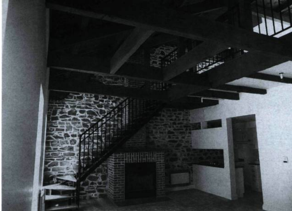
Vue de l'intérieur d'un logement.