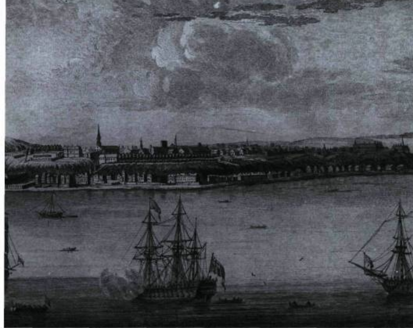
Vue de la Ville de Québec. Prise en partie de la Pointe des Pères et en partie à bord de l'Avantgarde, vaisseau de guerre du Capt. Hervey Smyth.

ANQ, Québec (détail). N° P600-5/GH-470-136. Gravure/P. Benazach. s.d.