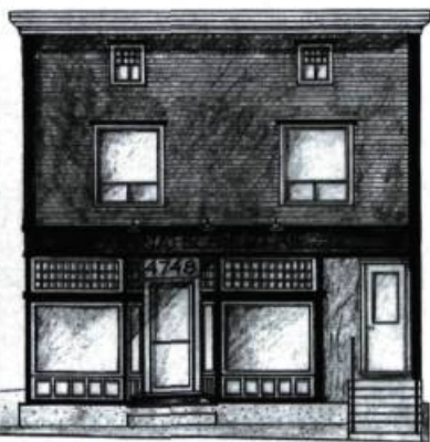
Témoign du passé, une quincaillerie des années 30 sauvée de la démolition.

et la maison Swan) témoignent de cette période historique teintée d'héroïsme. Le domaine et le moulin à farine des Legendre, cette première famille de souche française venue s'établir à Stornoway vers 1878, demeurent à ce jour en bon état (voir page suivante).