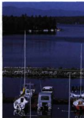
Marina de Lac-Mégantic.