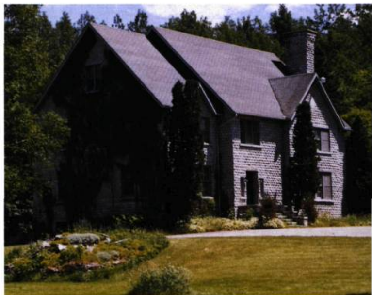
Domaine Legendre à Stornoway en 1883.

Ce premier immeuble détruit laisse présager de multiples interventions «de rajeunissement», qui affectent les secteurs commerciaux traditionnels au cours des années 80. Au même moment, l'ouverture en périphérie du carrefour Lac-Mégantic est perçue comme un incitatif à l'amélioration esthétique de l'ensemble des composantes des artères commerciales et plus précisément du centre-ville. En 1985, les gens d'affaires adhèrent au programme provincial Revi-Centre. Loin de répondre à cet objectif premier, les protagonistes évitent d'élaborer l'image à développer; de cette façon, les actions ont tout simplement contribué à banaliser le centre-ville. Le choix des matériaux et leur assemblage, l'absence de végétation, la prolifération des marquises fixées aux bâti-