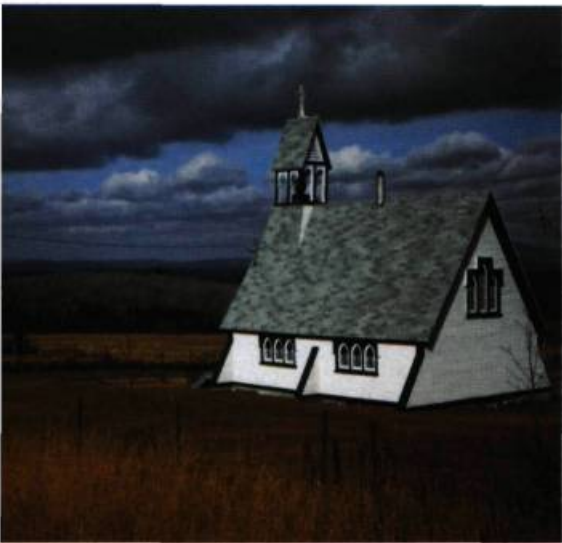
Église St. John de Ditchfield, premier canton qui accueille des Écossais vers 1860-1870.