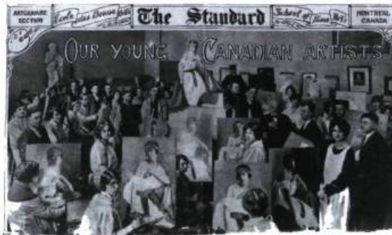
Cours à l'École des beaux-arts de Montréal vers 1924

Depuis son ouverture en 1933, le Musée du Québec a toujours manifesté, conformément à son mandat national, un intérêt pour l'art vivant. Dans cette perspective, il va de soi que les femmes artistes n'ont pas été négligées, tant du point de vue des acquisitions que des expositions. Par exemple, le tableau de Rita Mount, Percé , faisait déjà partie de la collection initia-