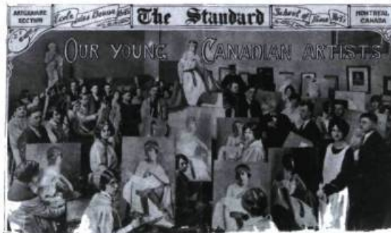
Cours à l'École des beaux-arts de Montréal vers 1924

Depuis son ouverture en 1933, le Musée du Québec a toujours manifesté, conformément à son mandat national, un intérêt pour l'art vivant. Dans cette perspective, il va de soi que les femmes artistes n'ont pas été négligées, tant du point de vue des acquisitions que des expositions. Par exemple, le tableau de Rita Mount, Percé , faisait déjà partie de la collection initia-