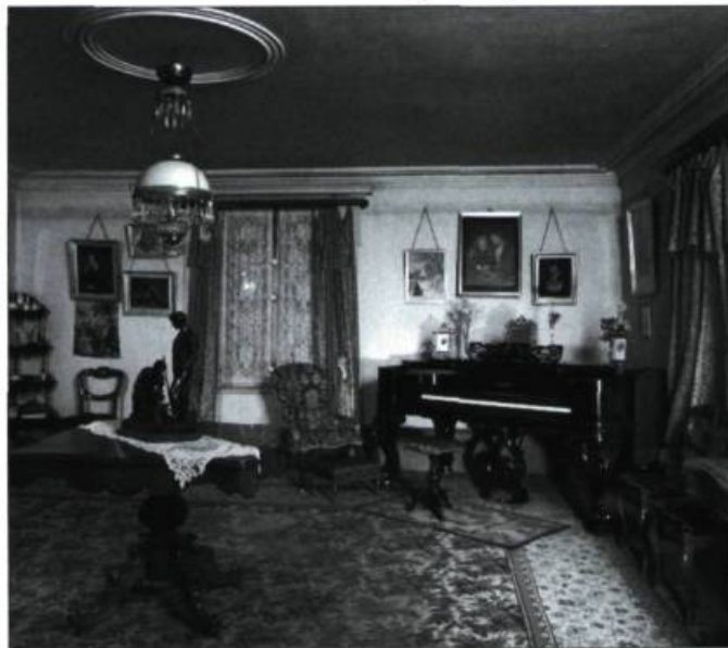
La maison a conservé ses couleurs et papiers peints d'origine et tous ses accessoires de la vie quotidienne.