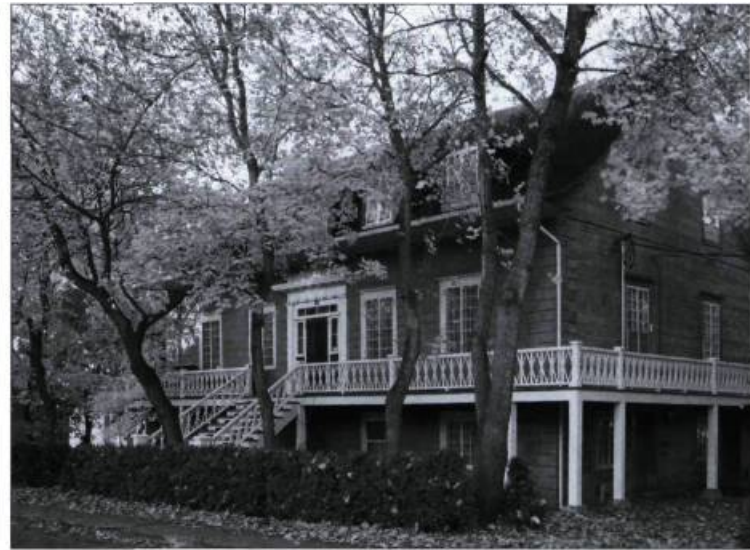
La maison Louis-Bertrand traduit la prestance de son bâtisseur.

de planches cloutées, abrite à l'origine la fonction commerciale — magasin général, entrepôt et bureau de poste, cabinet public — et les cuisines de la maison. Le premier étage, grandement éclairé et hautement dégagé du sol, compose l'étage « noble » : de chaque côté d'un vestibule intérieur prennent place le grand salon, dans toute son opulence victorienne — les plafonds font 3,5 mètres —, et une généreuse salle à manger, plus tard recyclée en vivoir. Au même niveau, à l'arrière, côté nord, on retrouve quatre chambres, dont celle plus vaste des maîtres, avec système de cloche relié aux cuisines pour l'appel des domestiques et celle dite « du salon » réservée aux visiteurs. Au troisième niveau, dans l'espace