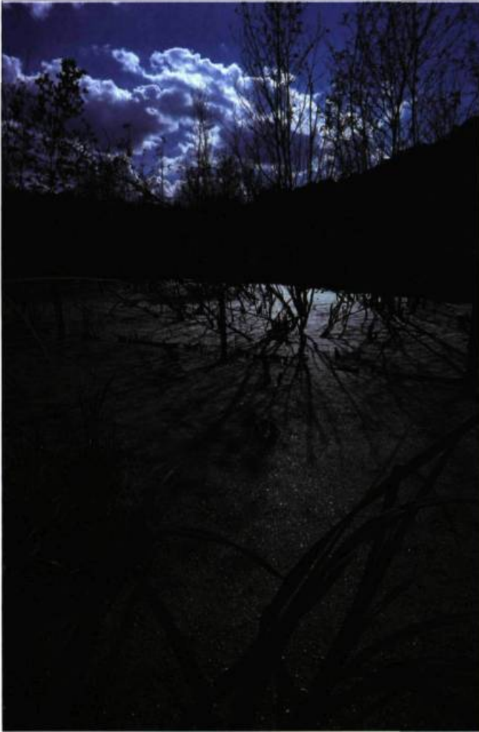
Le paysage naturel est, pour tous les peuples autochtones, signification de vie. Pour eux, le territoire est sacré.

Le paysage naturel, ou considéré comme tel, est, pour tous les peuples autochtones, signification de vie. Vie actuelle, certes, mais aussi vie passée, en racontant les origines du peuple, et vie future, en garantissant la continuité des ressources dont ils se considèrent les gardiens.