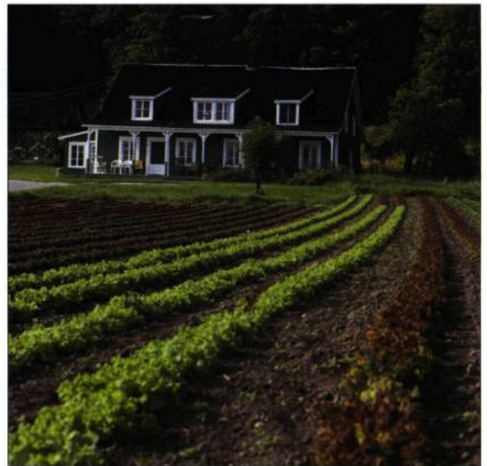
Le paysage rural porte des marques tangibles de l'action de l'homme.