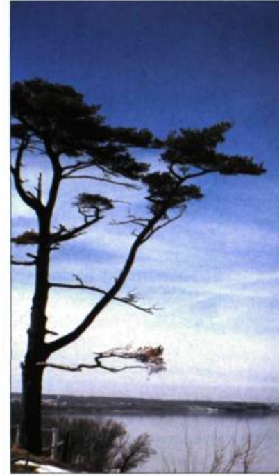
Les paysages de la Côte-Nord ont retenu l'attention des peintres qui en ont fait une lecture esthétique.

Le paysage rural, également support de la vie, porte des marques plus tangibles de l'action de