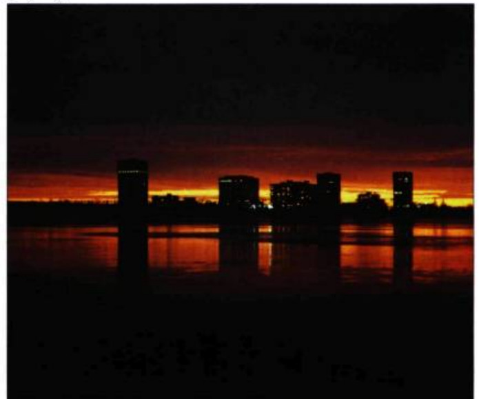
Vue à distance, la ville met à profit les données naturelles du site qu'elle amplifie ou banalise.

L'invention de la perspective à la Renaissance, technique nouvelle de visualisation, a placé l'observateur à l'extérieur du paysage, en position objective. Cette objectivation du paysage ouvrait la porte à diverses interprétations qui, en définitive, ont permis d'en faire ressortir plus nettement les aspects esthétiques, et plus particulièrement les caractéristiques régionales et patrimoniales. Les expériences picturales des XVI e et XVII e siècles ont fait éclore de nouvelles pratiques de composition et d'aménagement des paysages. En parallèle, le fait d'enregistrer, pour le regard collectif, l'aspect des lieux tels qu'il était perçu à des périodes de l'histoire aura mis en évidence les transformations survenues dans les paysages. Ces constats, plus particulièrement ressentis en Angleterre, auront contribué à l'émergence des mesures de protection des paysages ruraux.